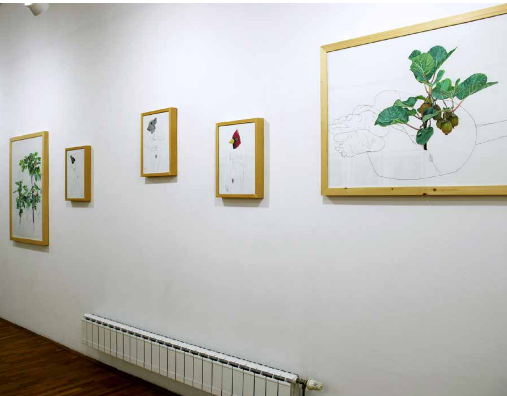
Sobivanje, 2014-2023, postavitev 2025.