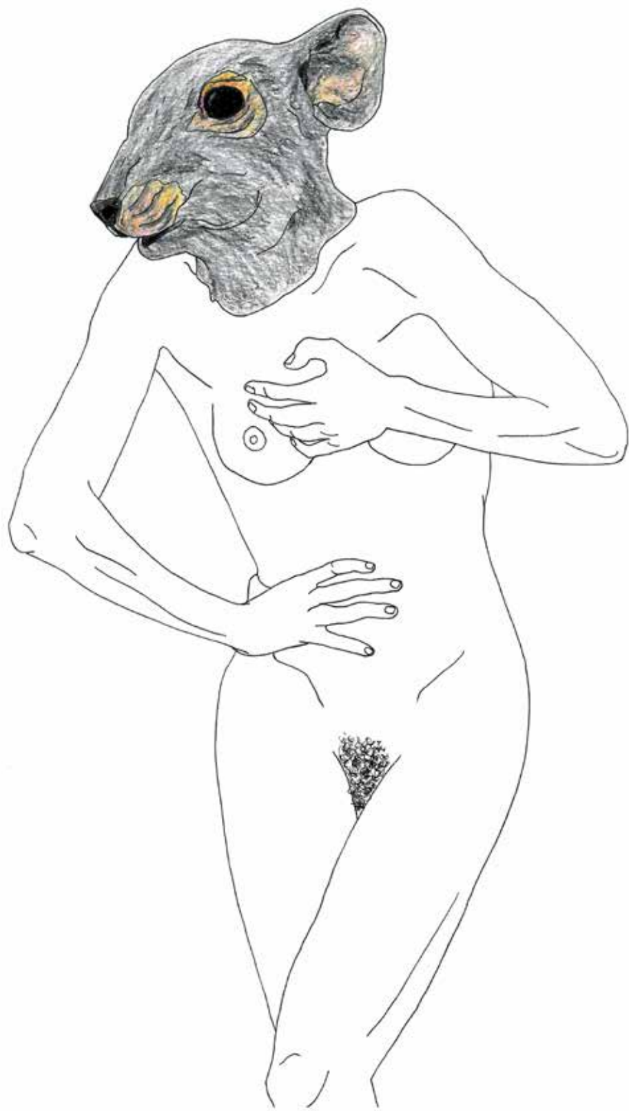
Miš, 2014, rapidograf, suhe akvarelne barvice, papir, 33 × 45 cm