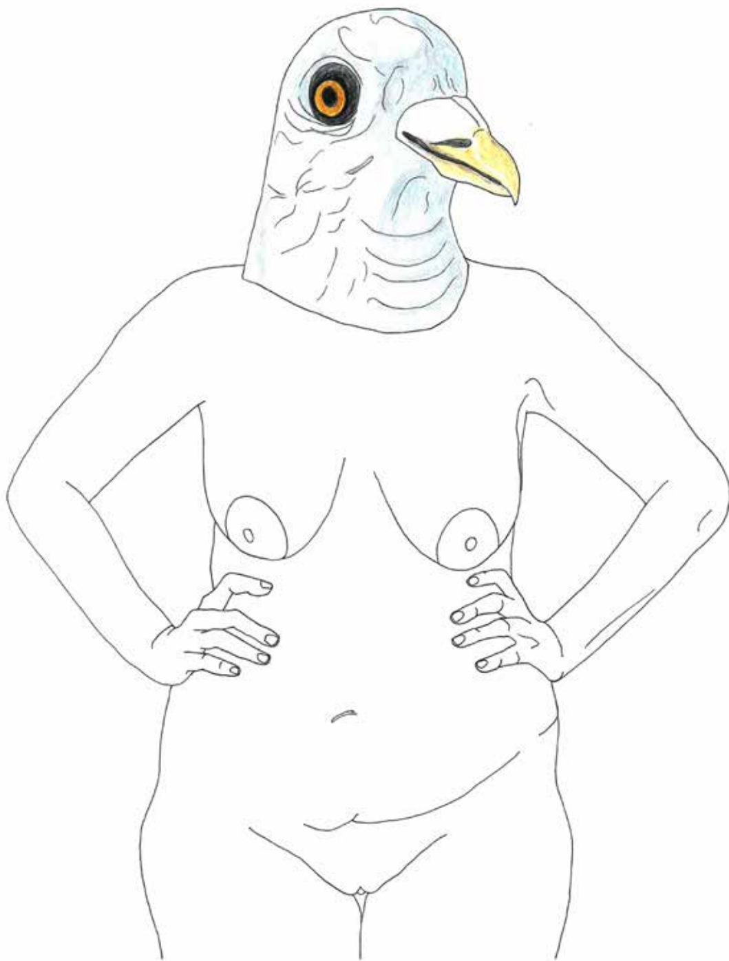
Golob, 2014, rapidograf, suhe akvarelne barvice, papir, 33 × 45 cm