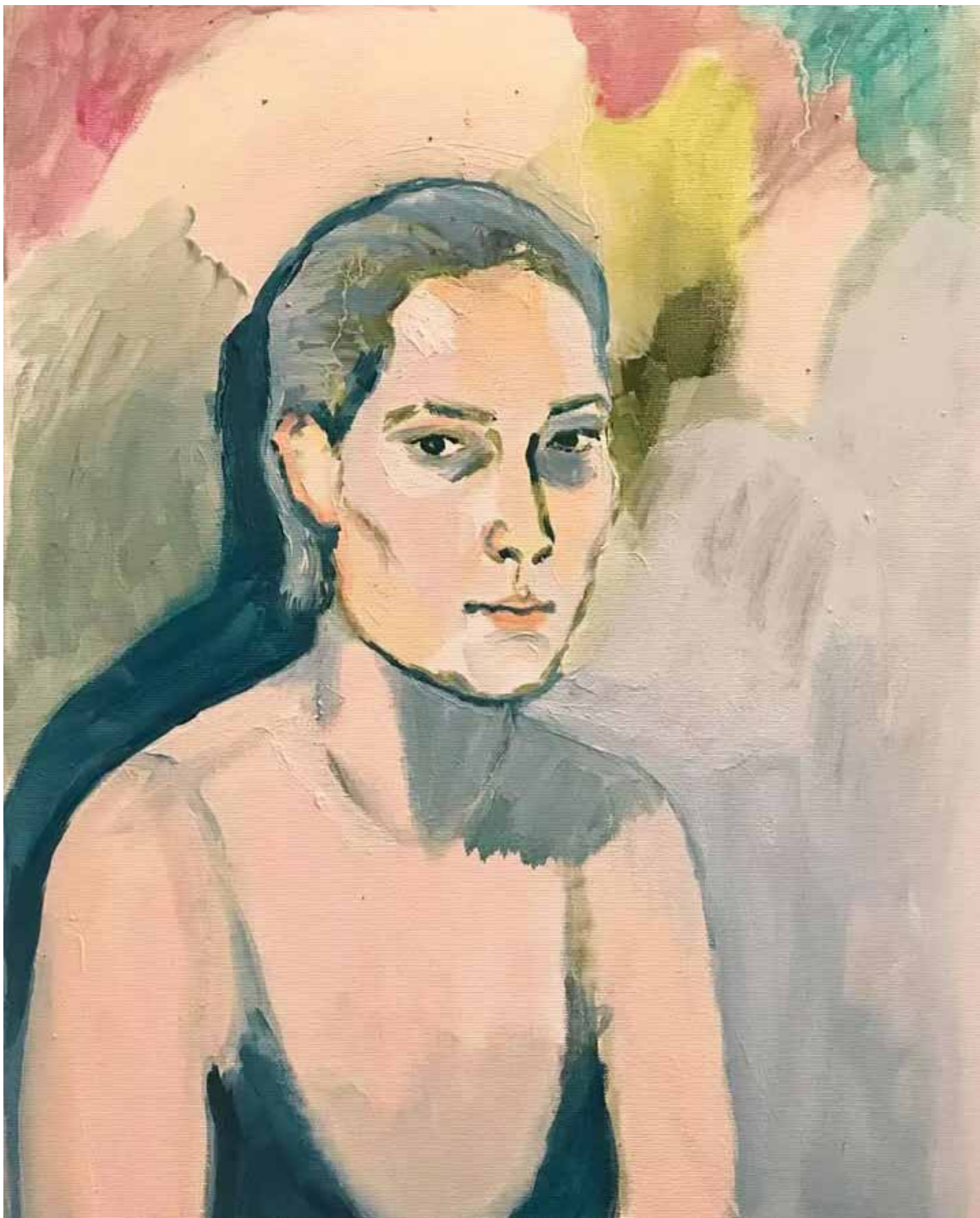
Sjenka, 2020, olje, platno, 40 × 50 cm