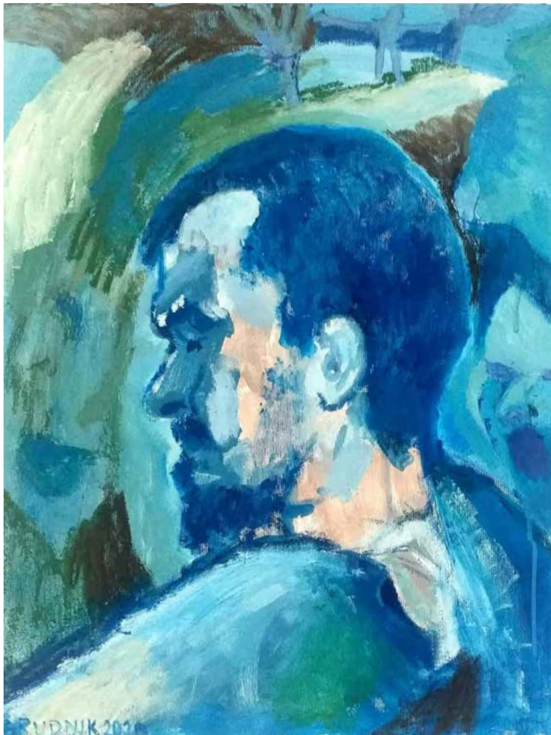
Pečina, 2020, olje, platno, 35 × 45 cm