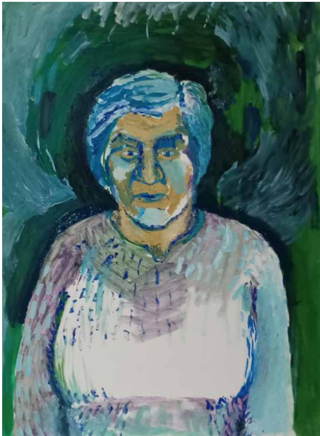
Jela, 2025, olje, papir, 42 × 56 cm