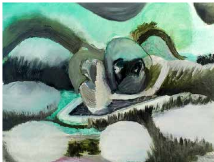
Zatišje po nevihti, 2021, olje, papir, 24 × 32 cm