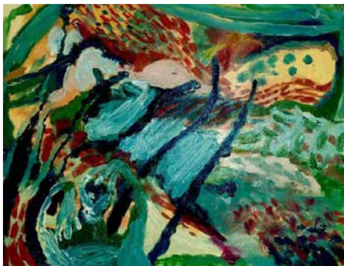
Pečina, 2020, olje, platno, 35 × 45 cm

Po večletnem posvečanju projektu Street anamnesis (eksperimentalni metodi psihološke anamneze) se najraje posveča slikanju intuitivnih portretov ter pisanju in snovanju zgodb in slikanic za otroke in otroke po srcu. K svojim delom pristopa z vprašanjem, kako sprejeti minevanje in doživeti prisotnost trenutka sedaj. Razstavljala je v Avstriji, Srbiji, Makedoniji, BiH, Hrvaškem, na Švedskem, v Črni gori, na Portugalskem in na Madžarskem. Živi in ustvarja v Velenju v Sloveniji in Mišičih v Črni gori.