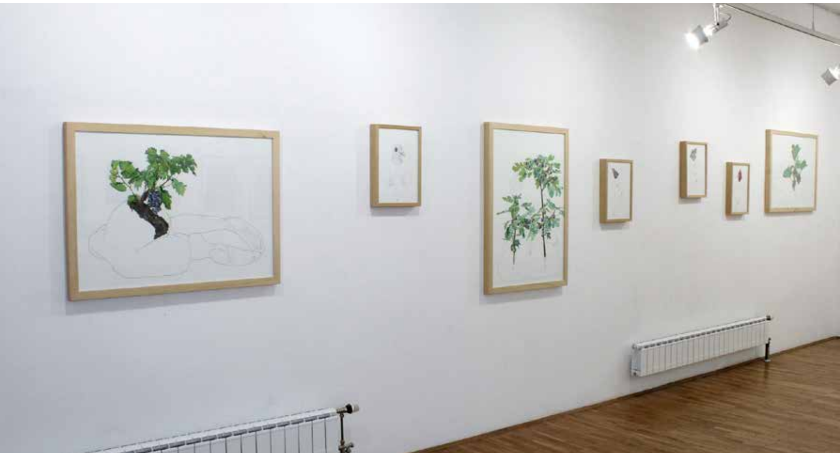
Sobivanje, 2014-2023, postavitvev 2025.