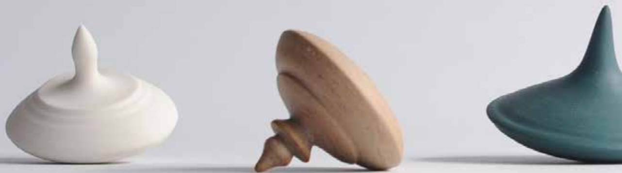
Opite plesalke, 2025, tehnika lončarskega vretena, pigmentiran porcelan, od 3 \times 3 \times 3 do 8 \times 8 \times 8 cm.