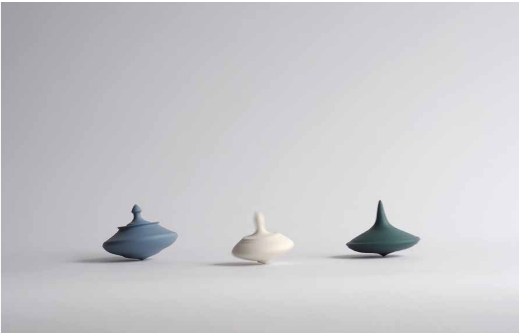
Opite plesalke, 2025, tehnika lončarskega vretena, pigmentiran porcelan, od 3 \times 3 \times 3 do 8 \times 8 \times 8 cm.