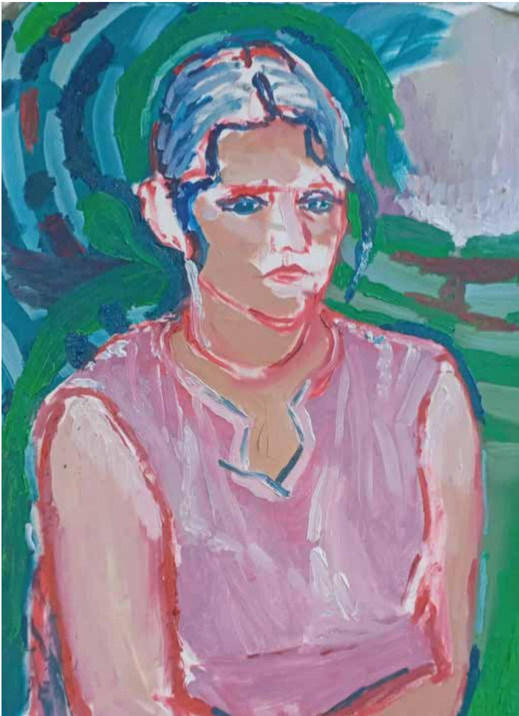
Mila, 2025, olje, papir, 42 × 56 cm