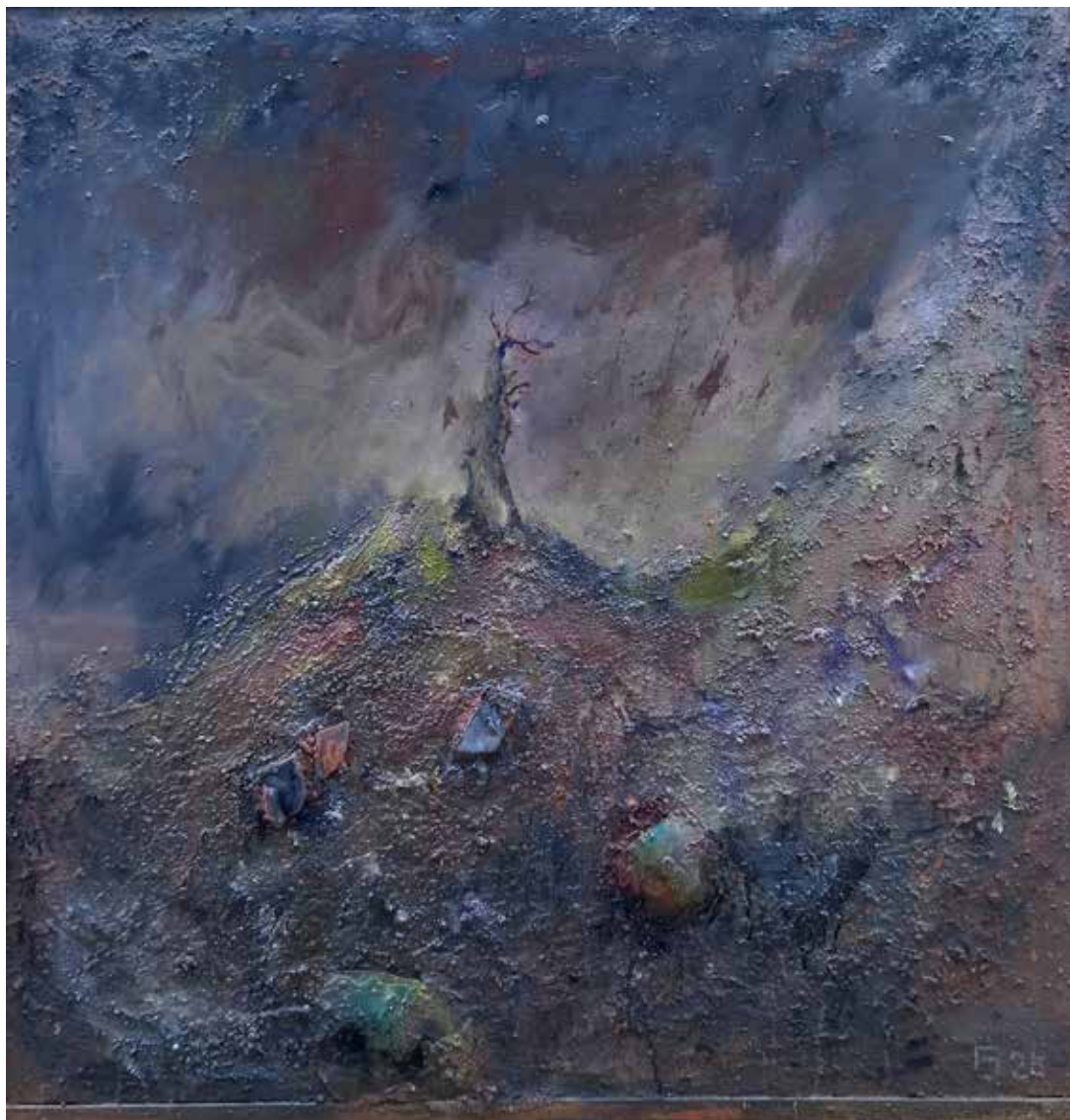
»2125«, 2025, mešna tehnika, platno, 107 × 100 cm