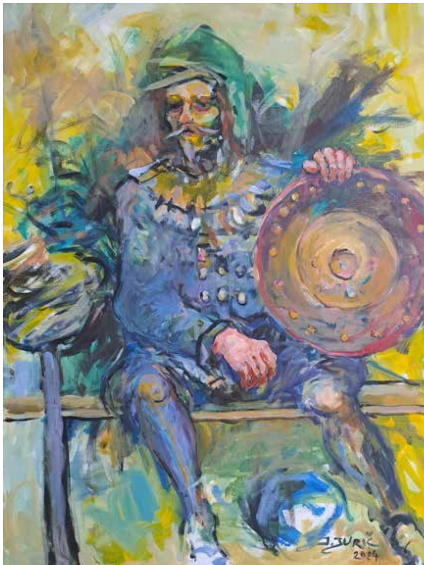
»Utrujen vojak«, 2024, akril, platno, 100 × 70 cm

V letih od 2004 do 2008 je bil lastnik umetniške galerije Agora v Mariboru. Od leta 2005 do 2011 je bil mentor likovne sekcije KUD Angel Besednjak v Mariboru. Leta 2016 se upokojil kot ravnatelj. Doslej je svoja slikarska dela predstavil na več kot dvajsetih samostojnih in približno šestdesetih skupinskih razstavah. Leta 2021 je imel samostojno razstavo v Galeriji DLUM v Mariboru, 2024 pa v Razstavišču kulturnega doma v Selnici ob Dravi. Živi in ustvarja v Mariboru.