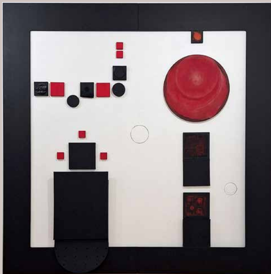
»Hommage Bauhausu«, 2025, stenska instalacija, mešana tehnika, 200 × 200 cm

Rojena je v Murski Soboti. Po končani gimnaziji v Murski Soboti je diplomirala na Naravoslovnotehniški fakulteti Univerze v Ljubljani, program Oblikovanje tekstilij in oblačil (prof. Darko Slavec). Študij je nadaljevala na ALU v Ljubljani (prof. Gorenc, prof. Vogelnik). Z odlično ocenjeno nalogo »En Soph – Asemblaži in teksturiranje skozi fraktale kabale« pridobi na VŠRS – Arthouse College of Visual Arts naziv magistrica likovnih umetnosti (prof. Mladen Jernejec). Svoja dela je predstavila na številnih samostojnih, mednarodnih žiriranih in skupinskih razstavah doma in v tujini. Leta 2013 je imela pregledno razstavo svojih del v GML. Ob tej priložnosti je izšla njena monografija in podelitev priznanja za kulturne dosežke doma in v tujini. Je članica DLUM, ZDSLU, Avstrijskega društva likovnih umetnikov ter Društva mednarodnih svobodnih umetnikov. Živi in ustvarja v Lendavi.