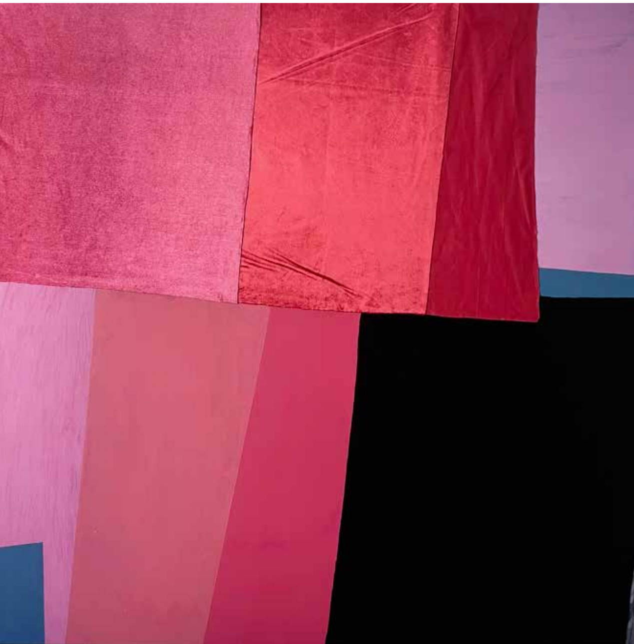
»Žametno polje (Rdeča)«, 2025, akril, tekstil, flomaster, platno, 120 × 120 cm

Galerija BV (Celovec, Avstrija, 2024) idr. Razstavljala je na več kot stopetdeset skupinskih razstav. Prejela več nagrad in priznanj doma in v tujini: Prix Le Quotidien de l'Art, Salon Réalités Nouvelles (Pariz, Francija, 2023). Živi in dela kot samozaposlena v kulturi v Mariboru, kjer ji je MOM dodelila umetniški atelje.