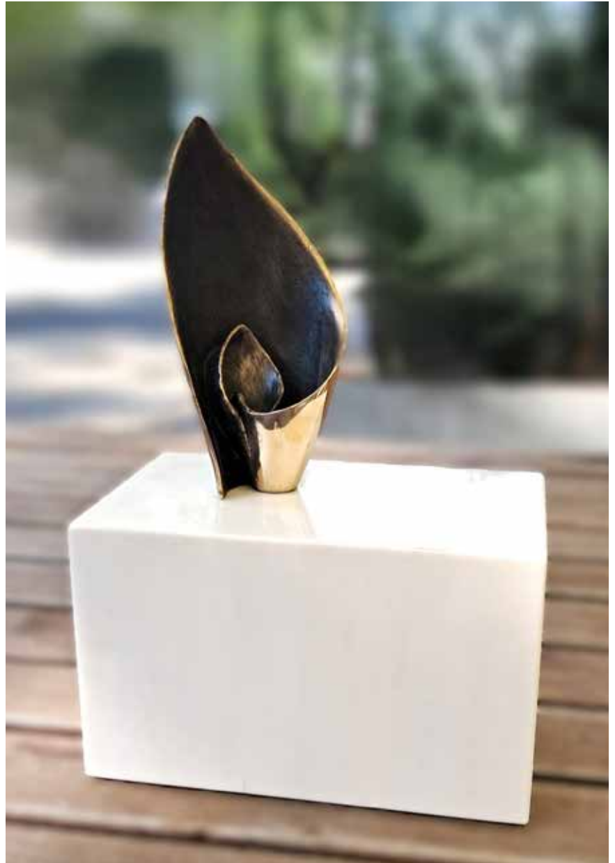
»Človek čuva naravo – narava človeka«, 2025, bron, kamen, 24 × 14,5 × 29 cm

Slovenskih Konjicah, Spominske plošče žrtvam letalske nesreče na gori sv. Petra na Korziki in 15 drugih javnih spomenikov. Kot samozaposlena v kulturi živi in dela v Mariboru.