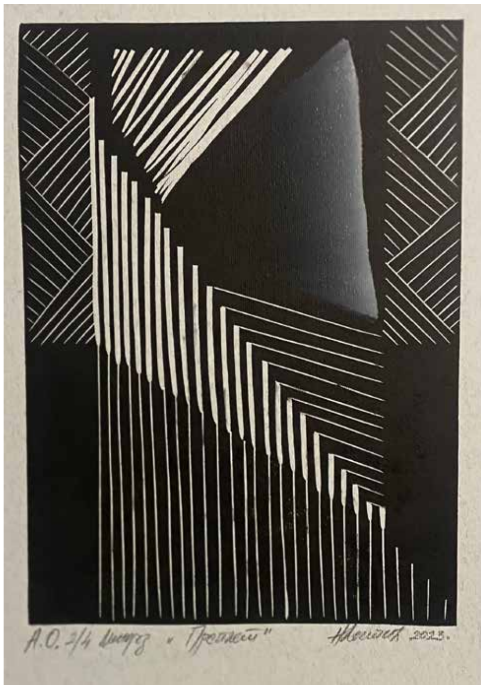
»OKNO«, 2023, barvni linorez, papir, 40 × 30 cm

skupinskih razstav doma in v tujini, bil je tudi udeleženec več mednarodnih kolonij in simpozijev. Je dobitnik nagrade Longin 2003 – kot mladi likovni ustvarjalec. Od leta 2018 je član DLUM in od leta 2022 član ZDSLU. Živi in ustvarja v Novem Sadu.