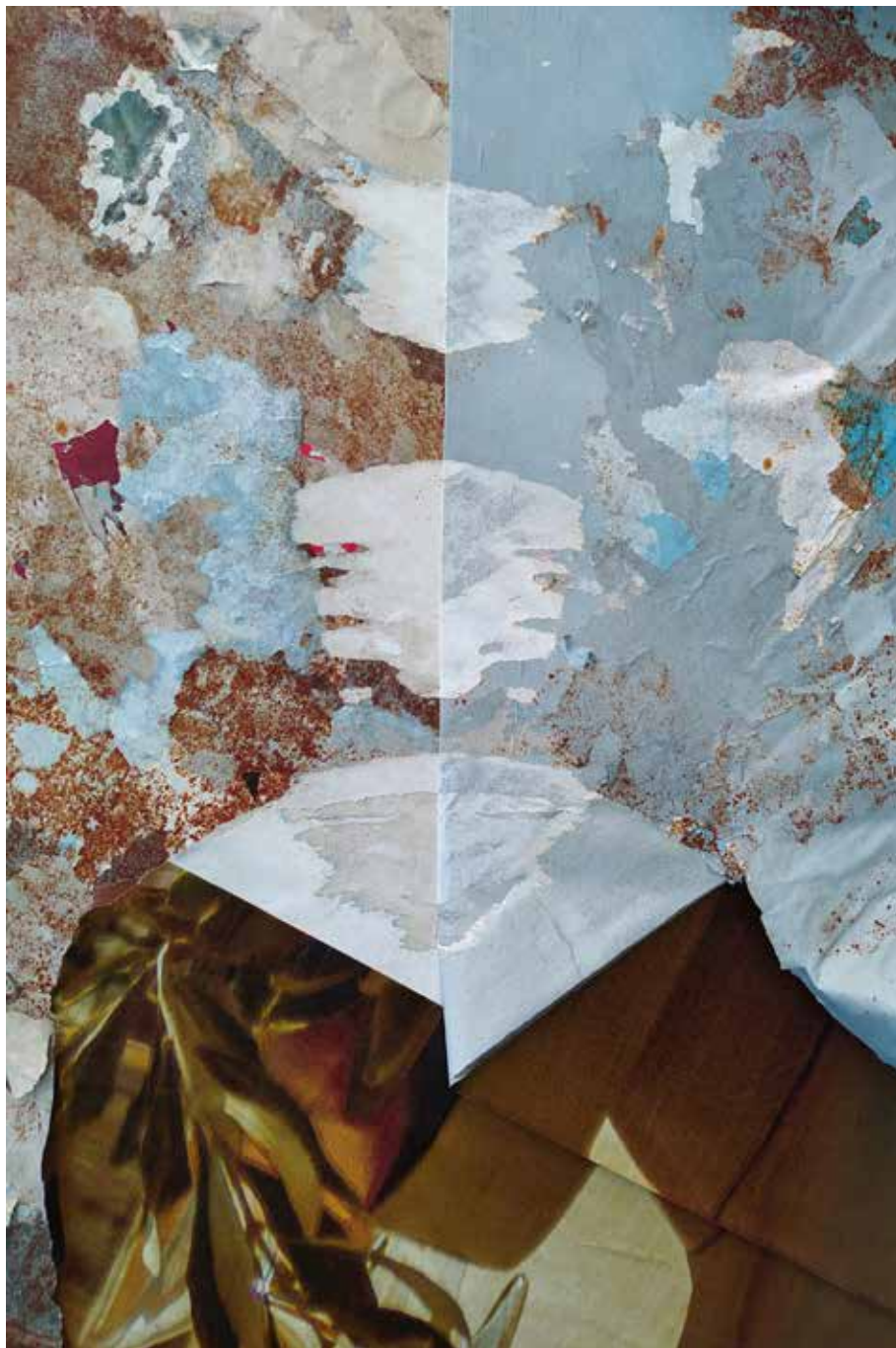
»Prevoj prostora in časa«, 2025, mešana tehnika, papir, 60 × 40 cm

Rojen je leta 1971 v Mariboru. Izobraževanje za kustose sodobne umetnosti je zaključil na SCCA-Ljubljana v letu 2003 pod mentorstvom Mirana Moharja in Gregorja Podnarja. Fokus njegovega ustvarjanja so fotografija, pikturalni in skulpturalni objekti ter prostorske postavitve. Avtorjeva dela so uvrščena na razstave slovenske sodobne umetnosti in mednarodne prikaze. Živi in ustvarja v Mariboru.