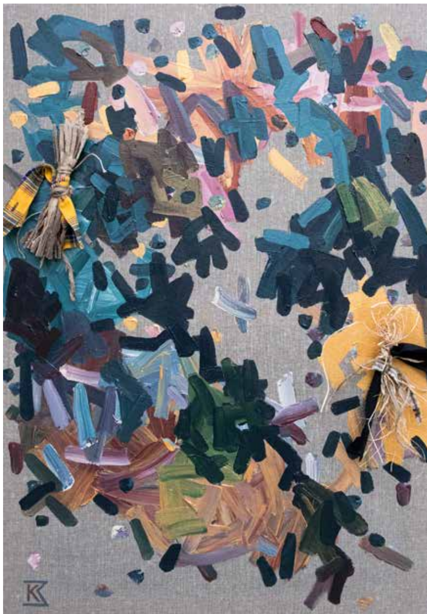
»Somrak«, 2025, mešana tehnika, platno, 100 × 70 × 12 cm

samostojni razstavi »To Catch the Birds« (Instalacija strašil po poljih v Križevcih pri Ljutomeru, 2023) in »Most skozi znano« (Galerija DLUM, 2023) ter skupinska razstava »Ljubljana se klanja Sloveniji VIII« (Galerija Vžigalica, 2024). Živi in ustvarja v Trbovljah.