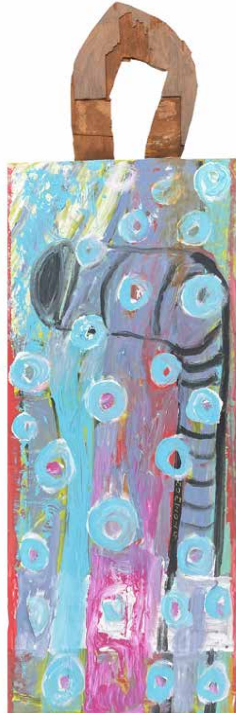
»Mehurčki«, 2025, akril, les, platno, 150 × 50 cm

Rojen je leta 1962 v Mariboru. Najprej je študiral na Pedagoški akademiji v Mariboru, kasneje pa nadaljuje študij na oddelku slikarstva Akademije za likovno umetnost v Ljubljani, kjer diplomira leta 1995 (prof. E. Bernard), in nato magistrira leta 2001. Prejel je študentsko Prešernovo nagrado. Razstavlja samostojno in skupinsko doma in v tujini. Je član DLUM. Živi in ustvarja v Rušah.