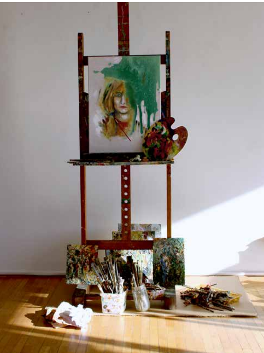
»MOJA PALETA (Avtoportret)«, 2025, prostorska instalacija, mešana tehnika, 200 × 120 × 100 cm

slikarstva in fotografije. Je član Fotokluba Maribor, DLUM (od 1986), Esperantskega društva, HKD. Avtor spomenika žrtvam NOV v Vidmu pri Ptuju (1984). Za svoje ustvarjanje je dobil več priznanj in nagrad. Bil je zmagovalec občinstva na Pesniškem turnirju za viteza poezije leta 2012, nagrajenec DLUM leta 2000 in 2012. Živi in ustvarja v Mariboru.