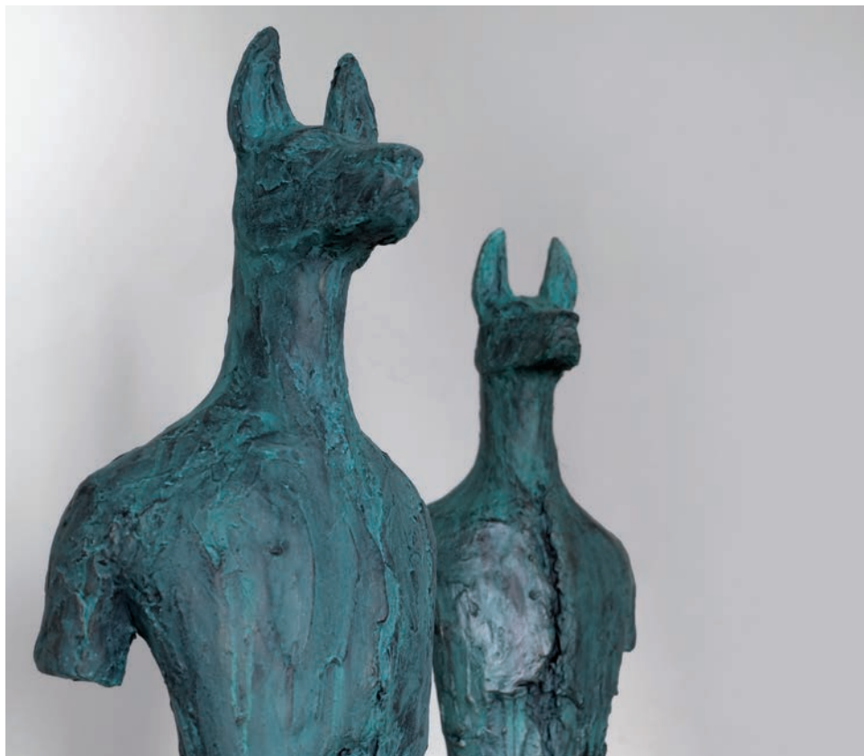
Musel-Muzzle, 2020, mešana tehnika, 240 x 120 x 70 cm