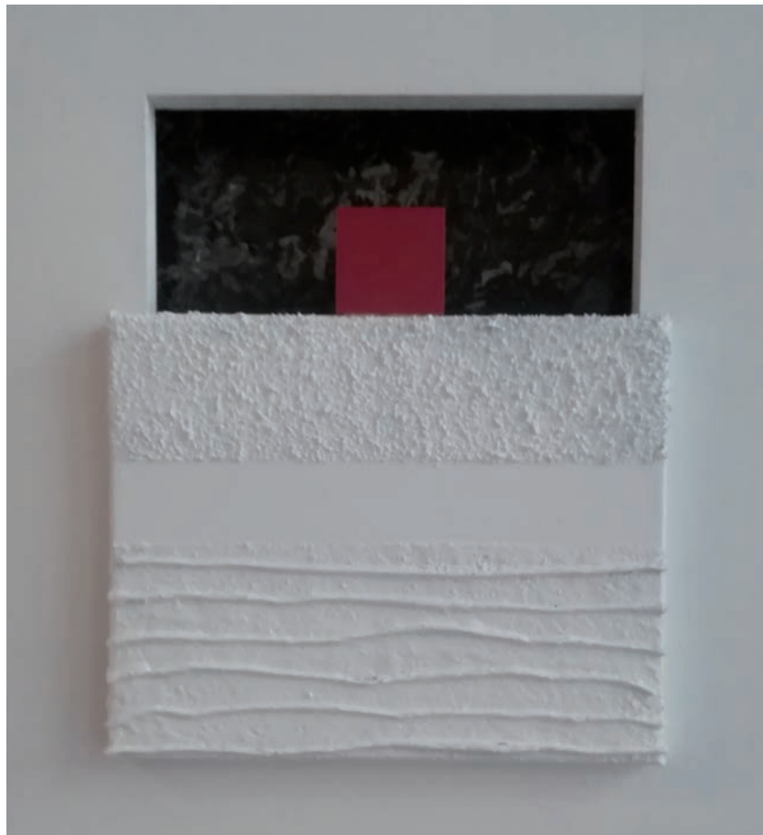
iz ciklusa Tišina strasti, 2019, mešana tehnika, 40 x 40 cm