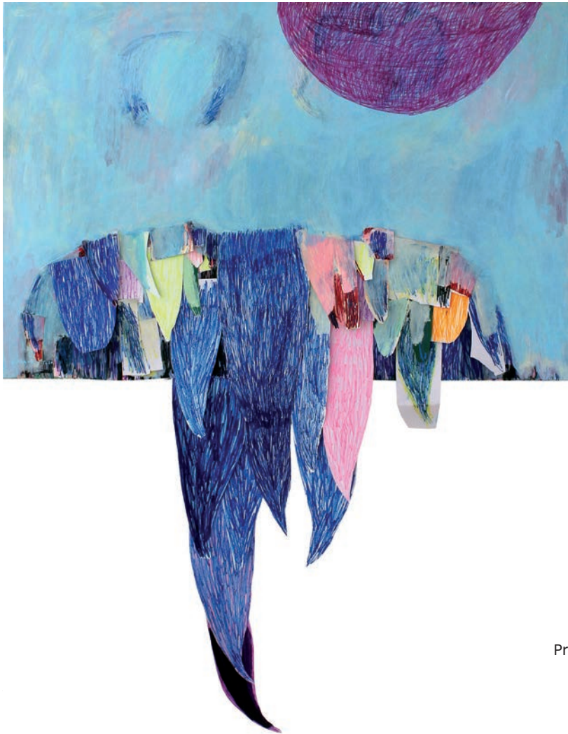
Prihod mavrice, 2020, mešane tehnike na platnu, 150 x 190 cm