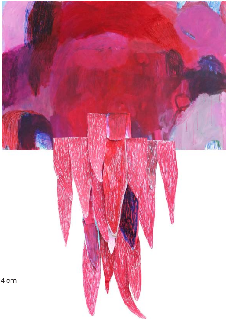
Rdeči dež-nagrajenka DLUM, mešane tehnike na platnu, 150 x 214 cm