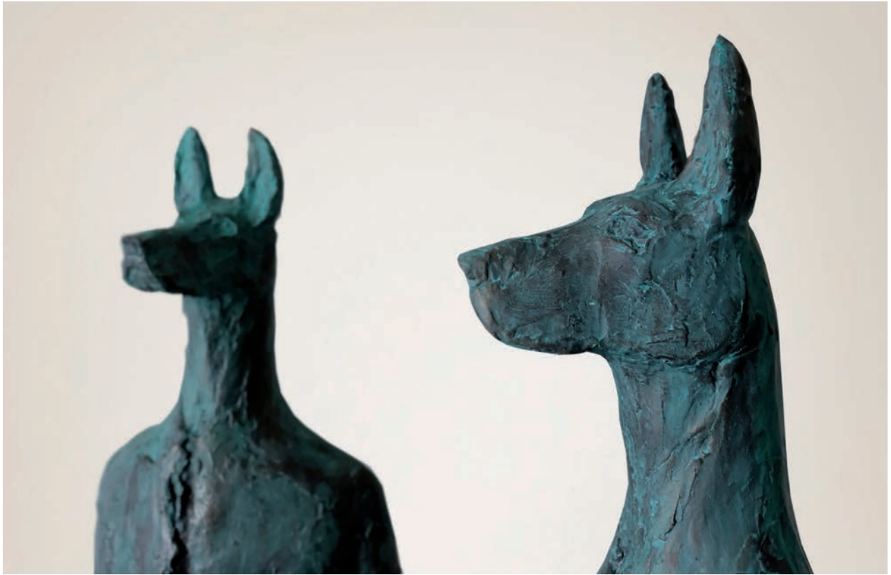
Musel-Muzzle, 2020, mešana tehnika, 240 x 120 x 70 cm