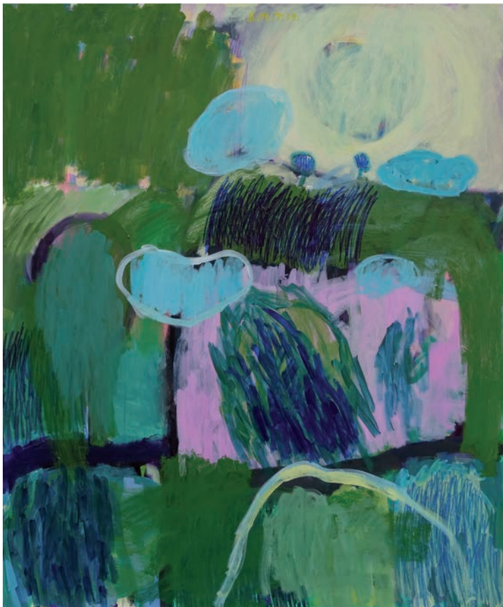
Sonce, ogrej me (Bosna), 2019, akril, mešane tehnike na platnu, 100 x 120 cm