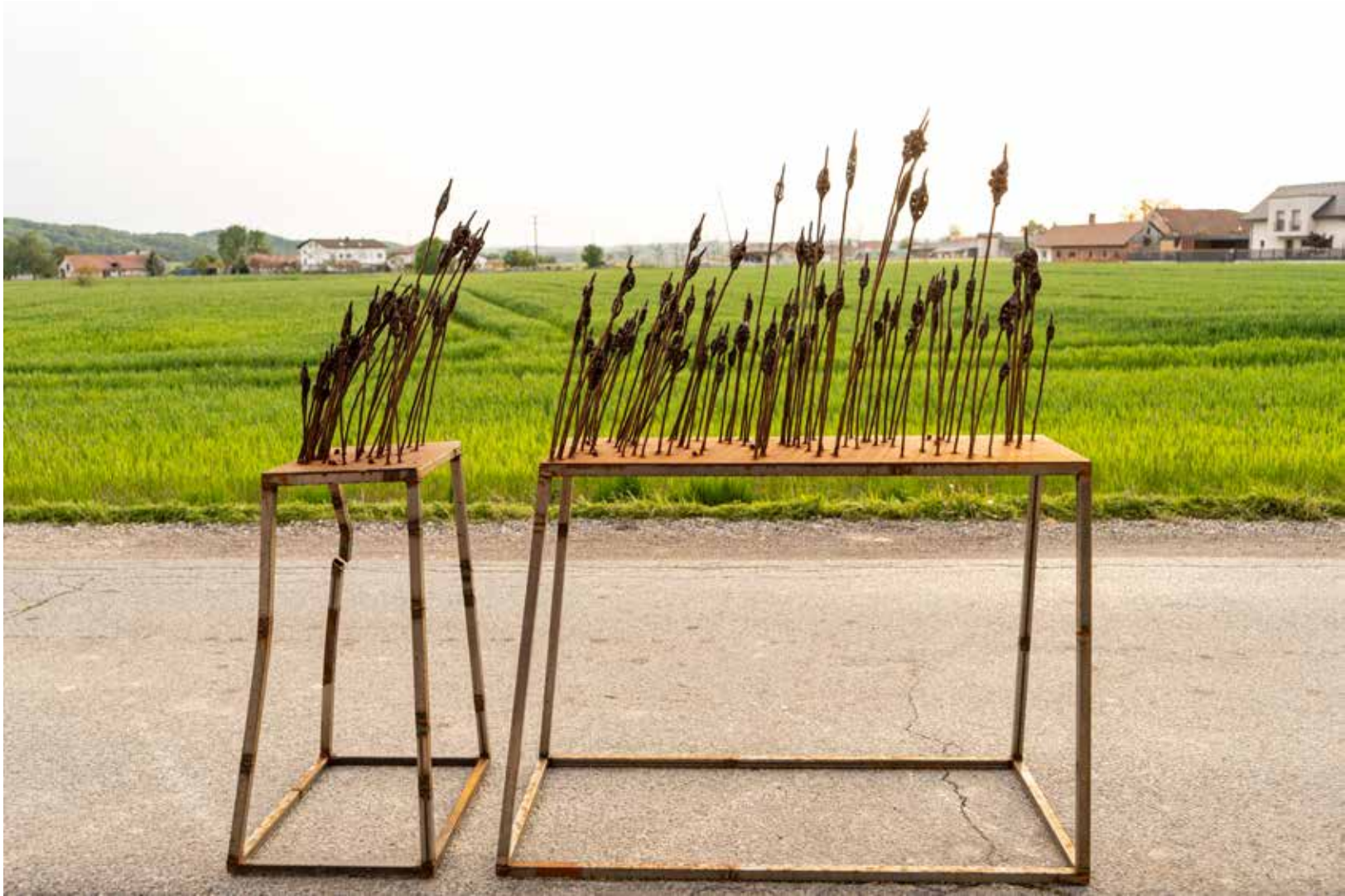
4. Povojno žito, 2025, varjeno železo, 166 × 160 × 58 cm