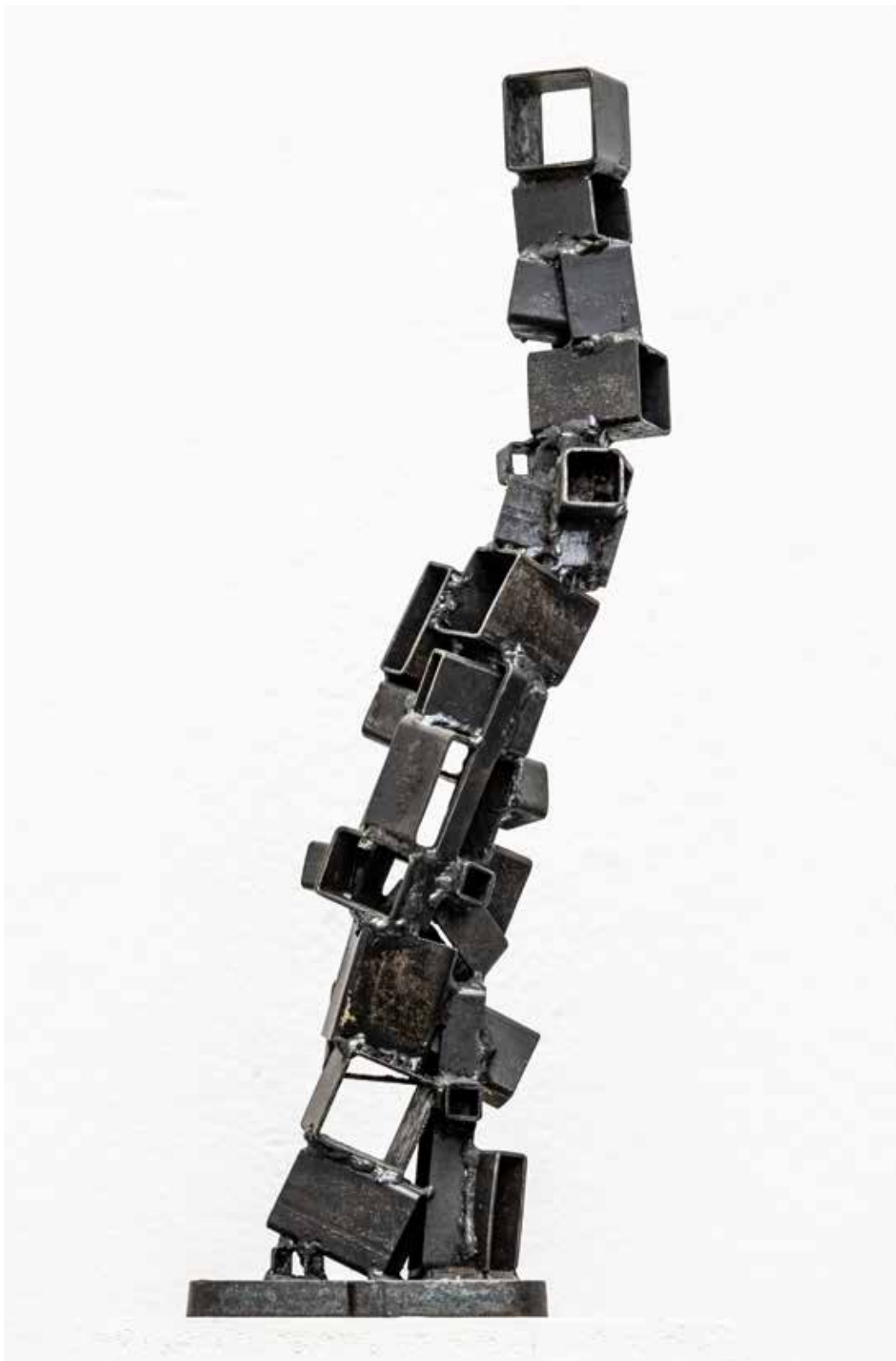
6. Stebri družbe, 2022, varjeno železo, 60 do 40 cm × 14 × 14 cm