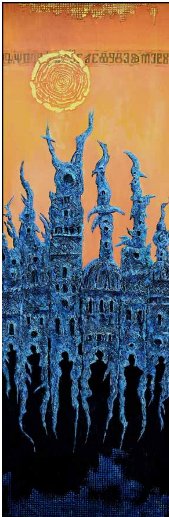
7. Portal , 2026, mešana tehnika, akril, platno, 120 × 40 cm Duh-Jurak