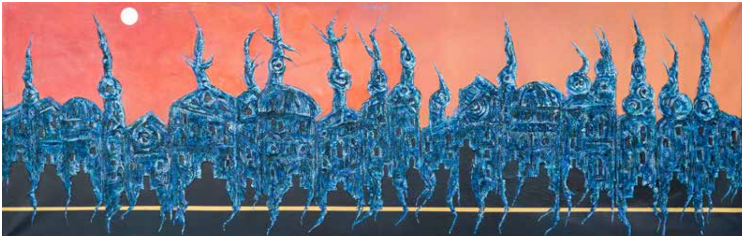
3. Portal, 2023, mešana tehnika, akril, platno, 40 × 120 cm