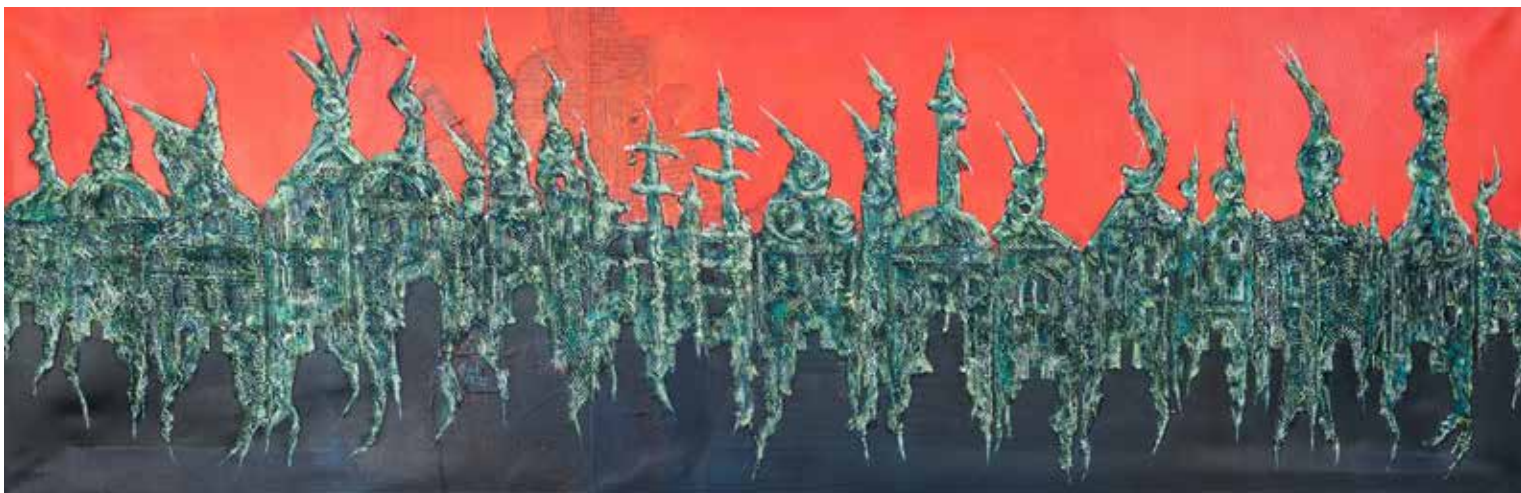
4. Portal, 2023, mešana tehnika, akril, platno, 40 × 120 cm