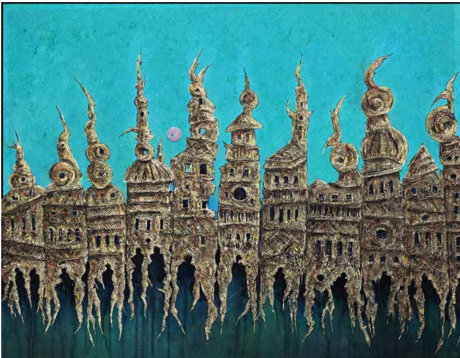
6. Portal, 2026, mešana tehnika, akril, platno, 75 × 115 cm Duh-Jurak