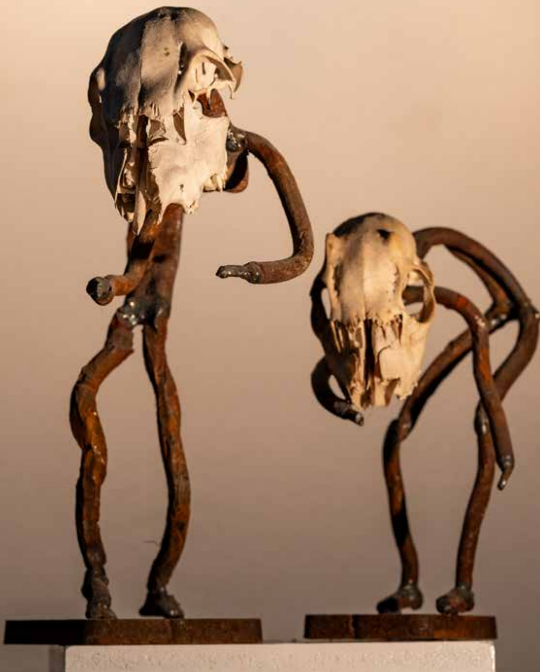
7. Stvorniki , 2022, varjeno železo, od 27 cm do 163 cm Duh-Jurak