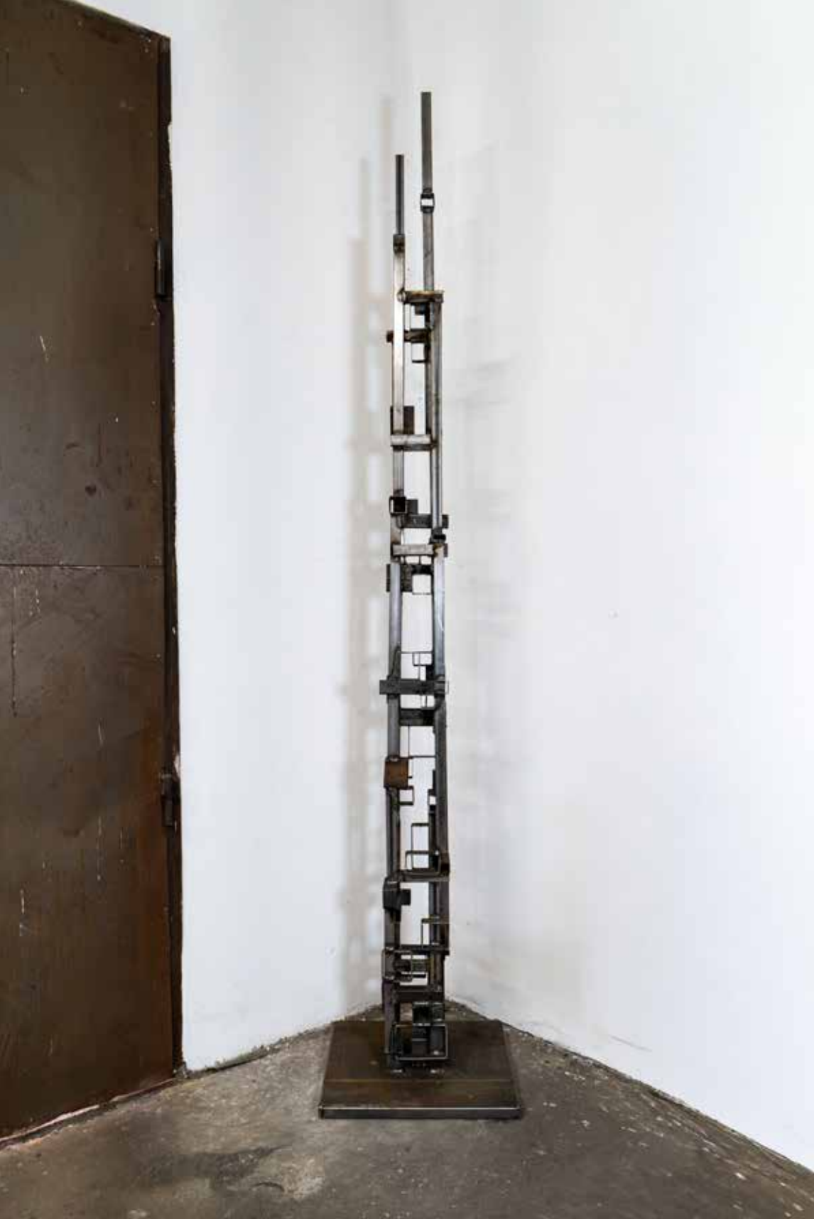
3. Kramp Taver, 2026, varjeno železo, 291 × 55 × 55 cm