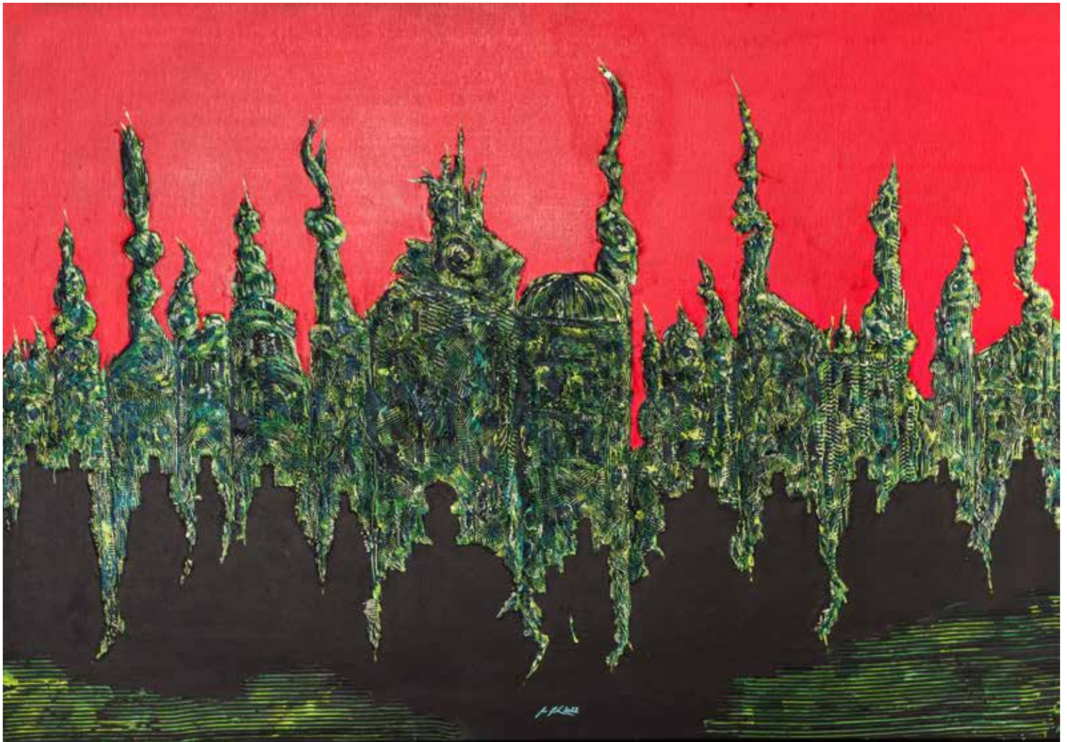
2. Portal, 2022, mešana tehnika, akril, platno, 70 × 100 cm