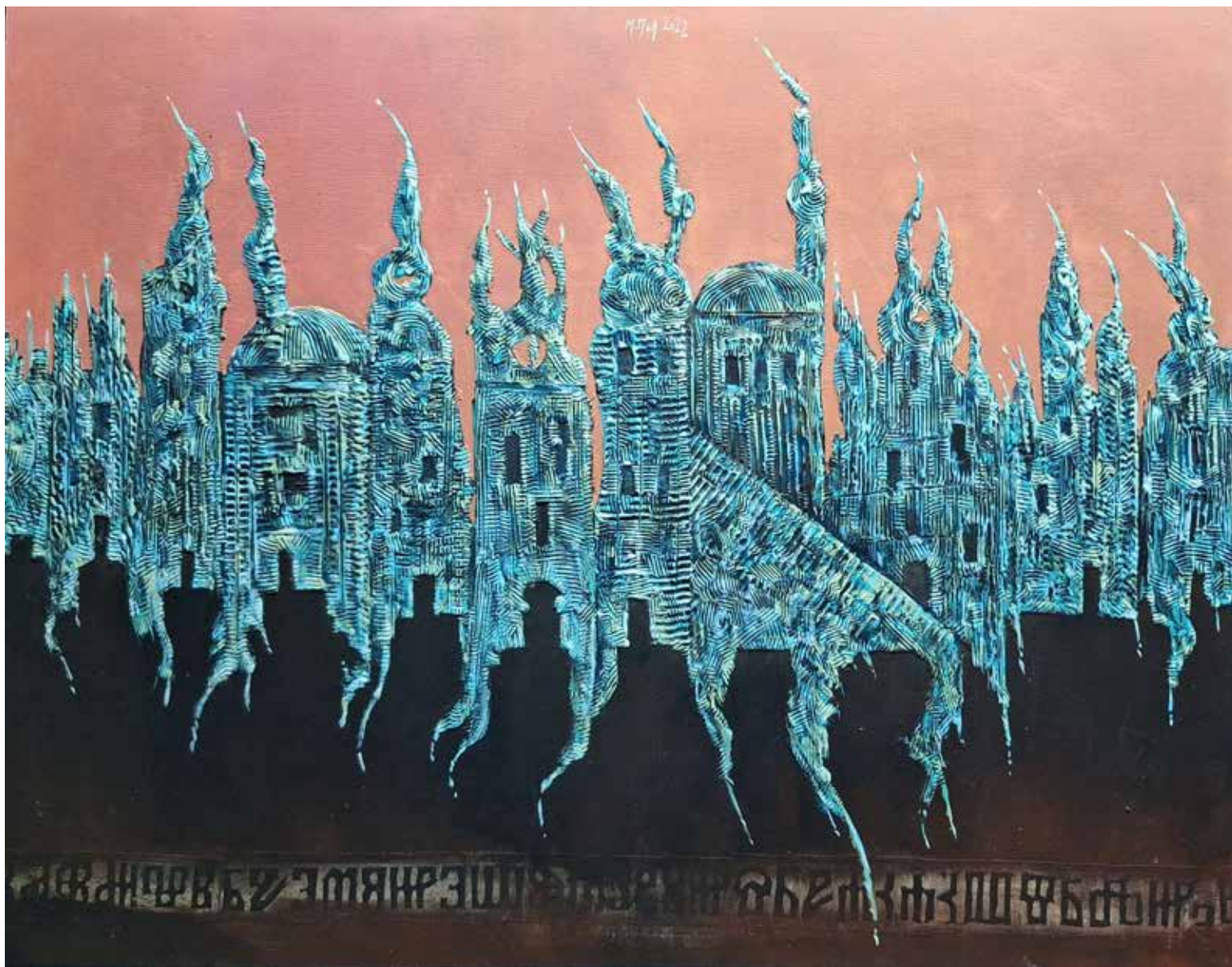
1. Portal, 2022, mešana tehnika, akril, platno, 50 × 65 cm