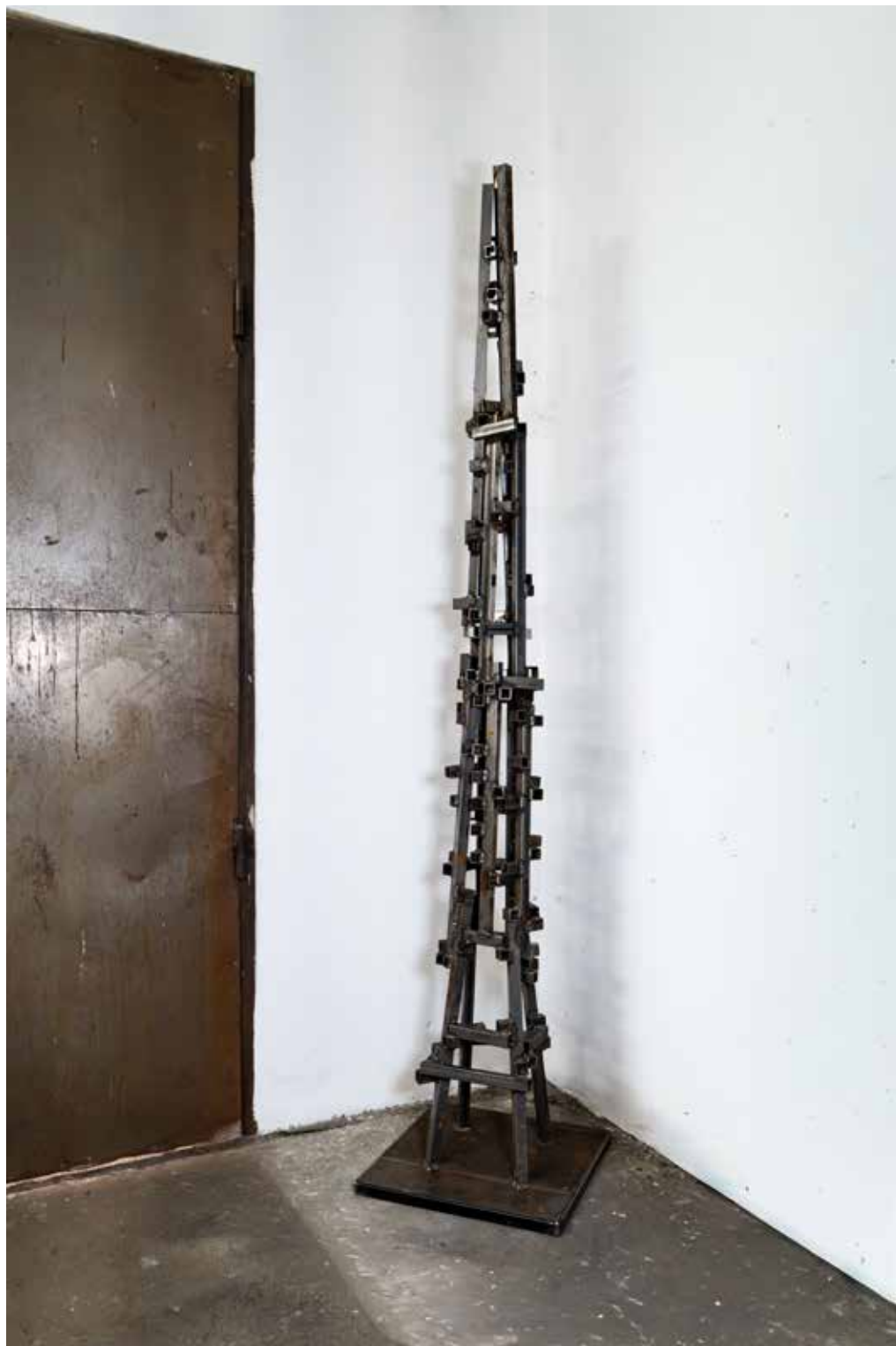
2. Cwajfel turn, 2026, varjeno železo, 270 × 55 × cm