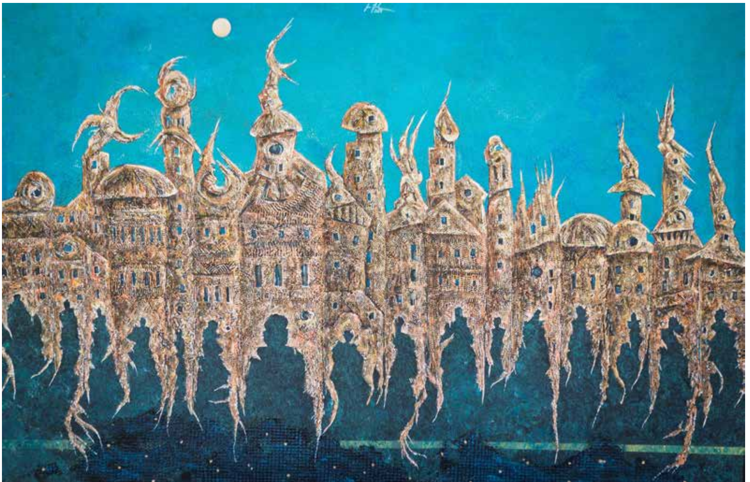
5. Portal, 2024, mešana tehnika, akril, platno, 75 × 115 cm