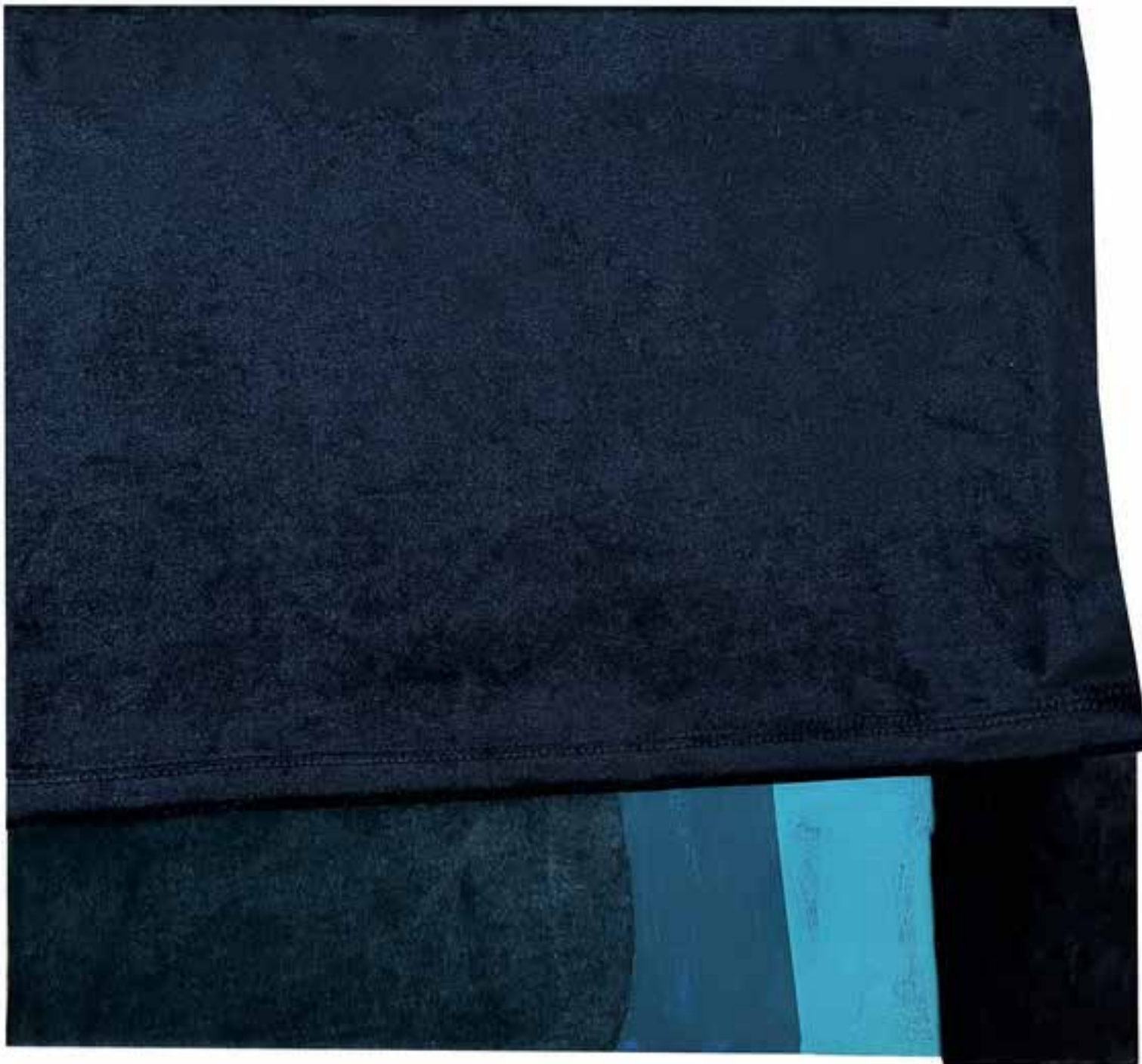
2. Žametno polje XLII, 2024, akril, tekstil, papir, 31 × 33,5 cm