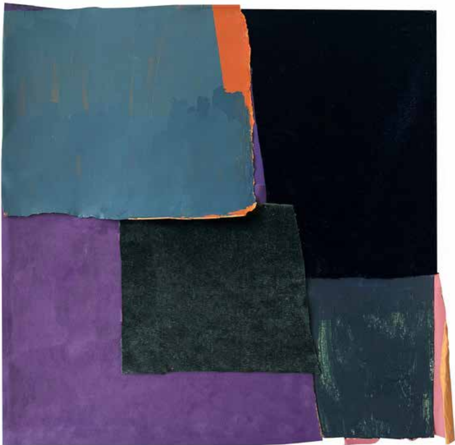
4. Žametno polje XXXIX, 2024, akril, tekstil, papir, 31 × 31 cm