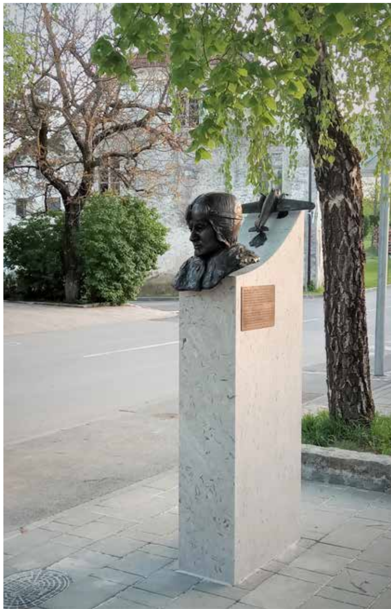
1. Spomenik Juriju Kraigerju - Žoru, Hrašče pri Postojni, maj 2023