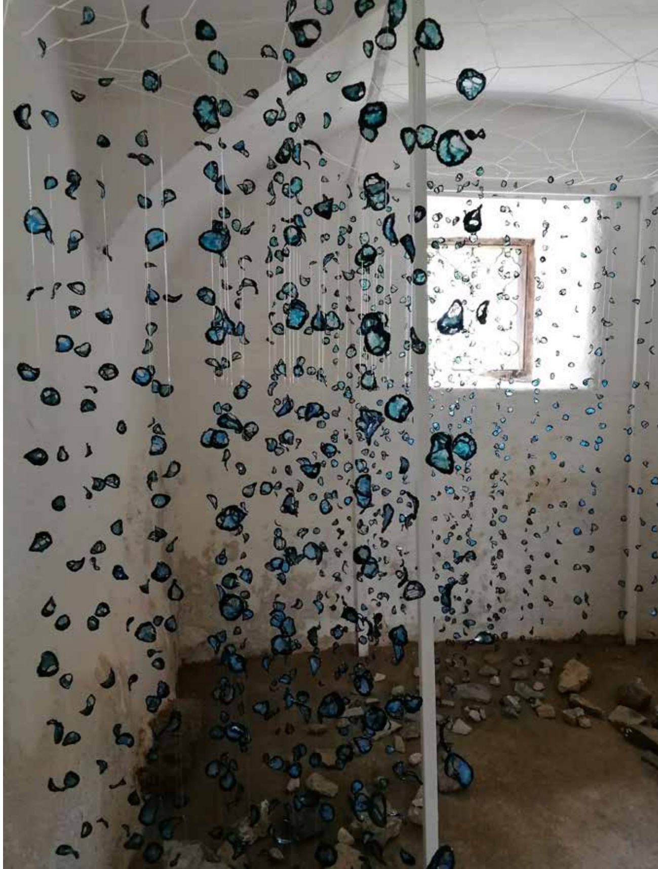
Šelestinke, prostorska postavitev - žica, najlon, akril, silk, kamenje, 2026