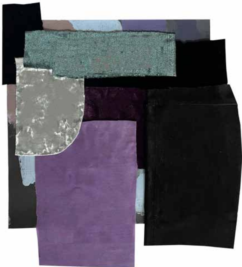
1. Žametno polje XLI, 2024, akril, tekstil, papir, 38 × 35 cm