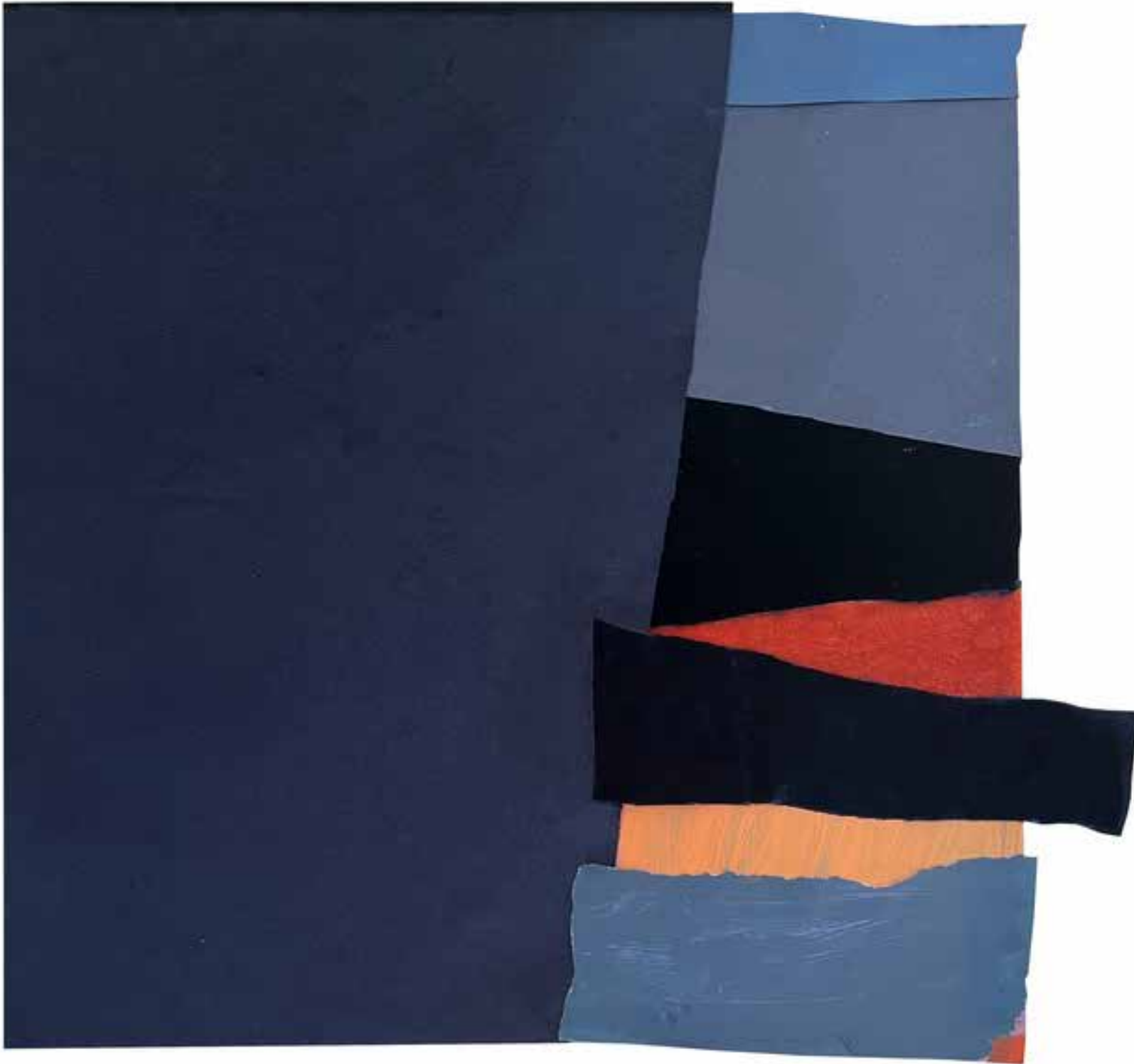
6. Žametno polje XXXVII, 2024, akril, tekstil in papir na papirju, 30 × 33 cm