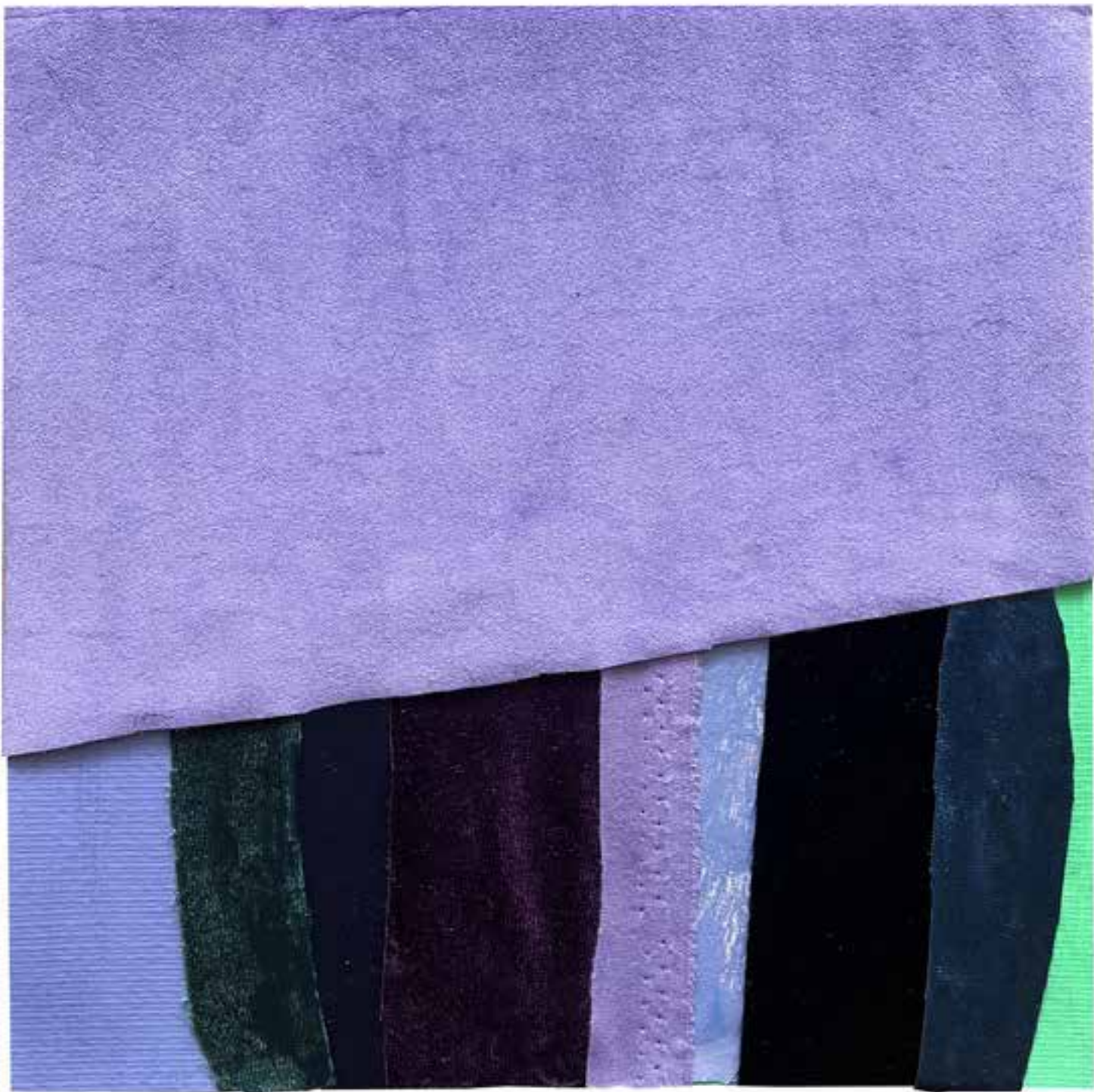
3. Žametno polje XLVI, 2024, akril in tekstil na papirju, 25 × 25 cm