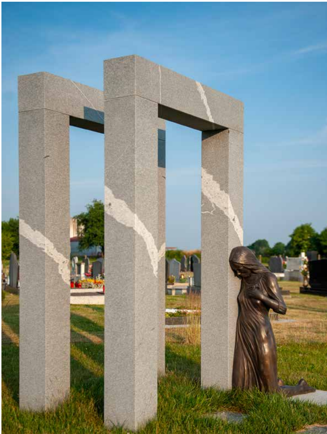
5. Žalujoča, spomenik za prostor za raztros pepela, pokopališče Tropovci, Tišina, junij 2022. Projekt je bil izveden v sodelovanju s krajinsko arhitektko Nino Čebela.