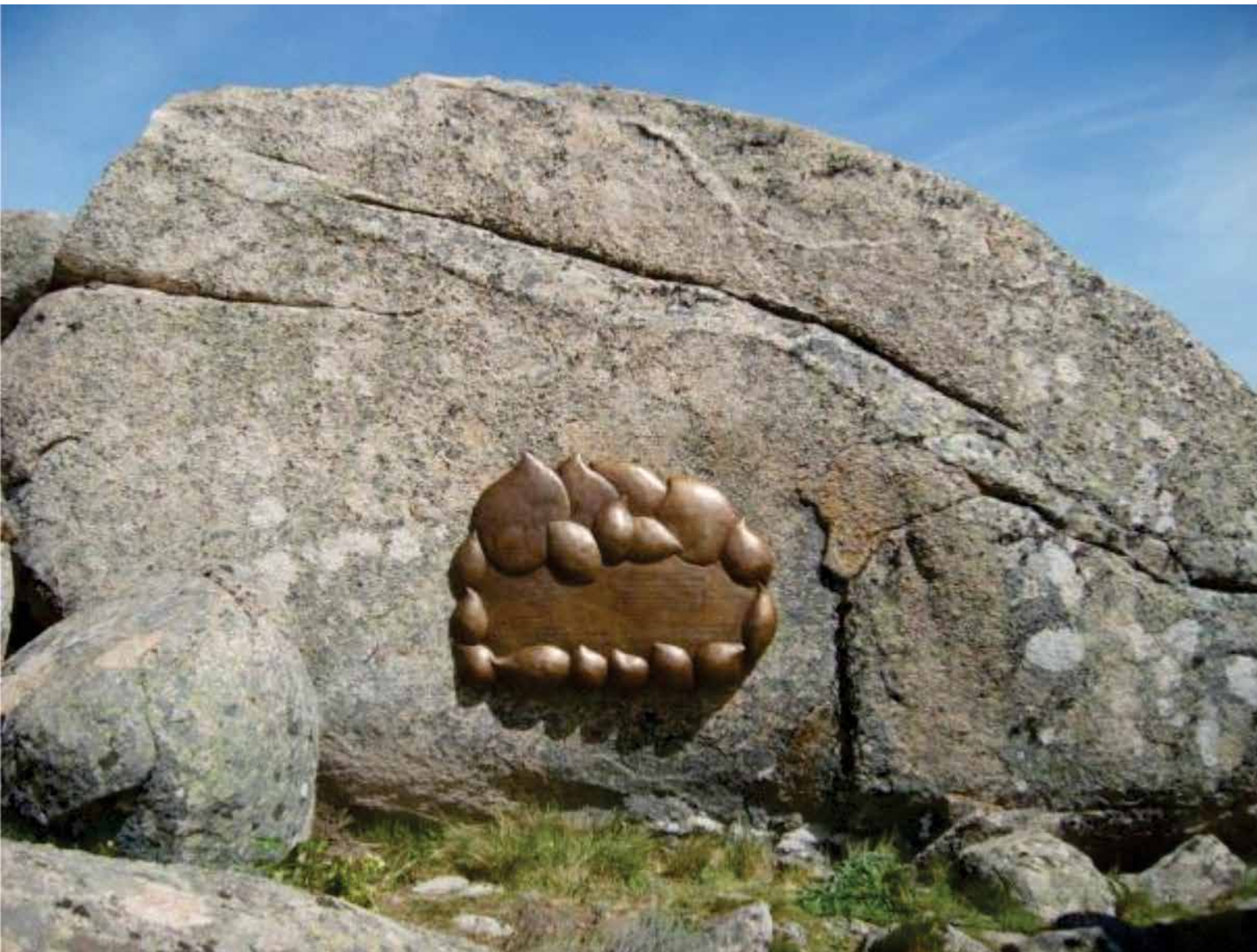
6. Spominska plošča žrtvam letalske nesreče na gori Sv. Petra, Korzika, maj 2008