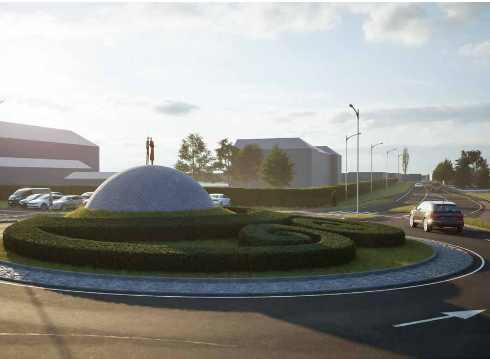
4. Idejni projekt za natečaj za rondo v Varaždinu, projekt v sodelovanju s krajinsko arhitektko Nino Čebela in arhitektom Primožem Brglezom, avgust 2024. Render: Primož Brglez