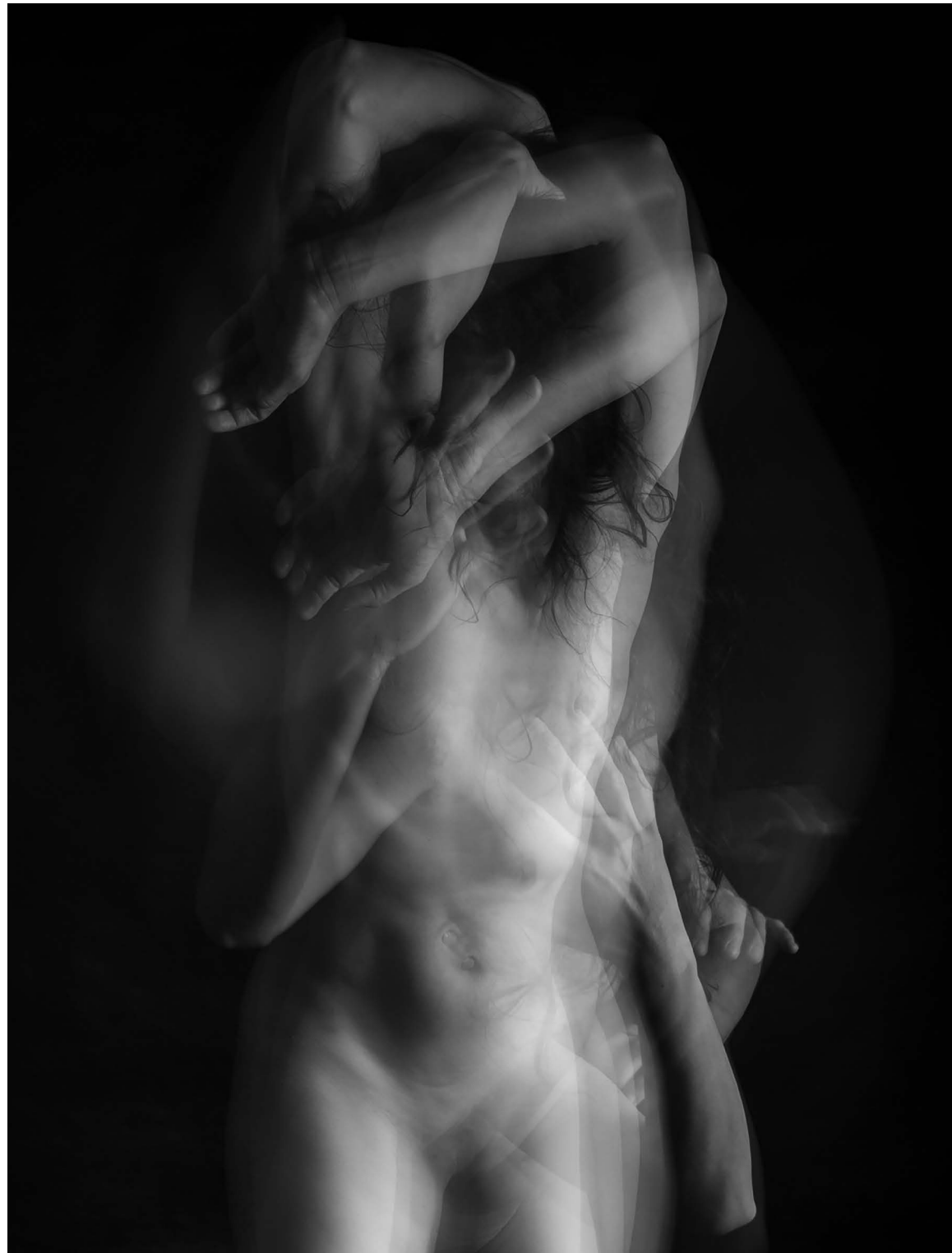
Nasilje nad ženskami 13