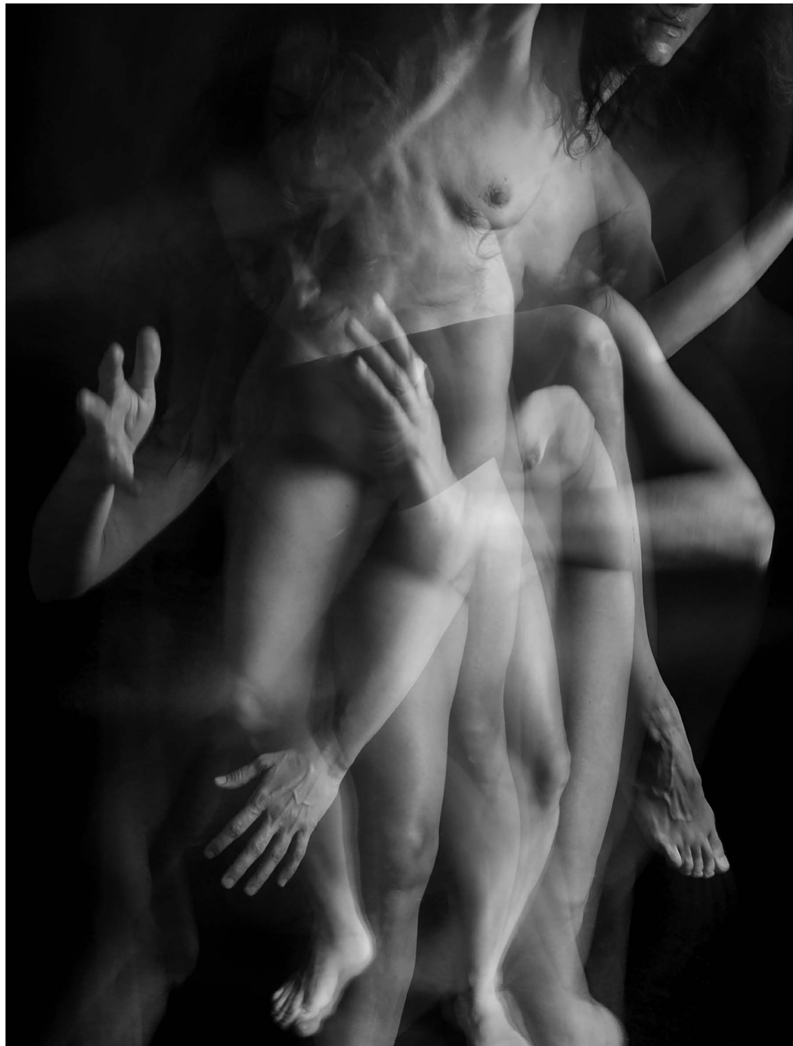
Nasilje nad ženskami 11