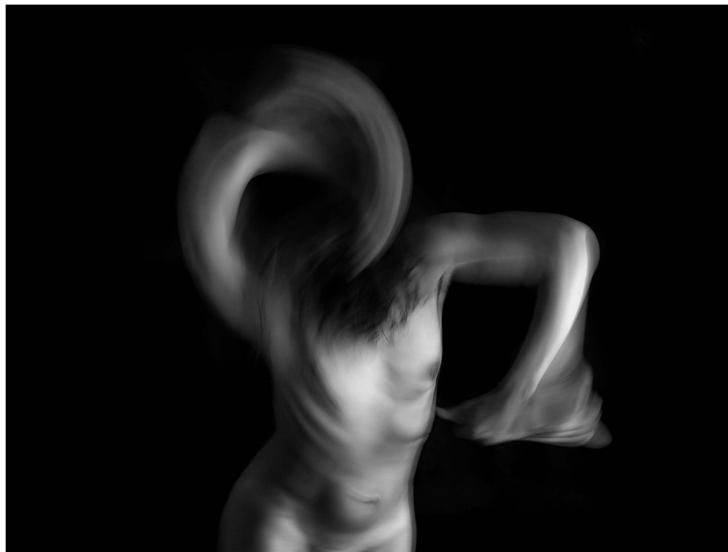
Nasilje nad ženskami 3