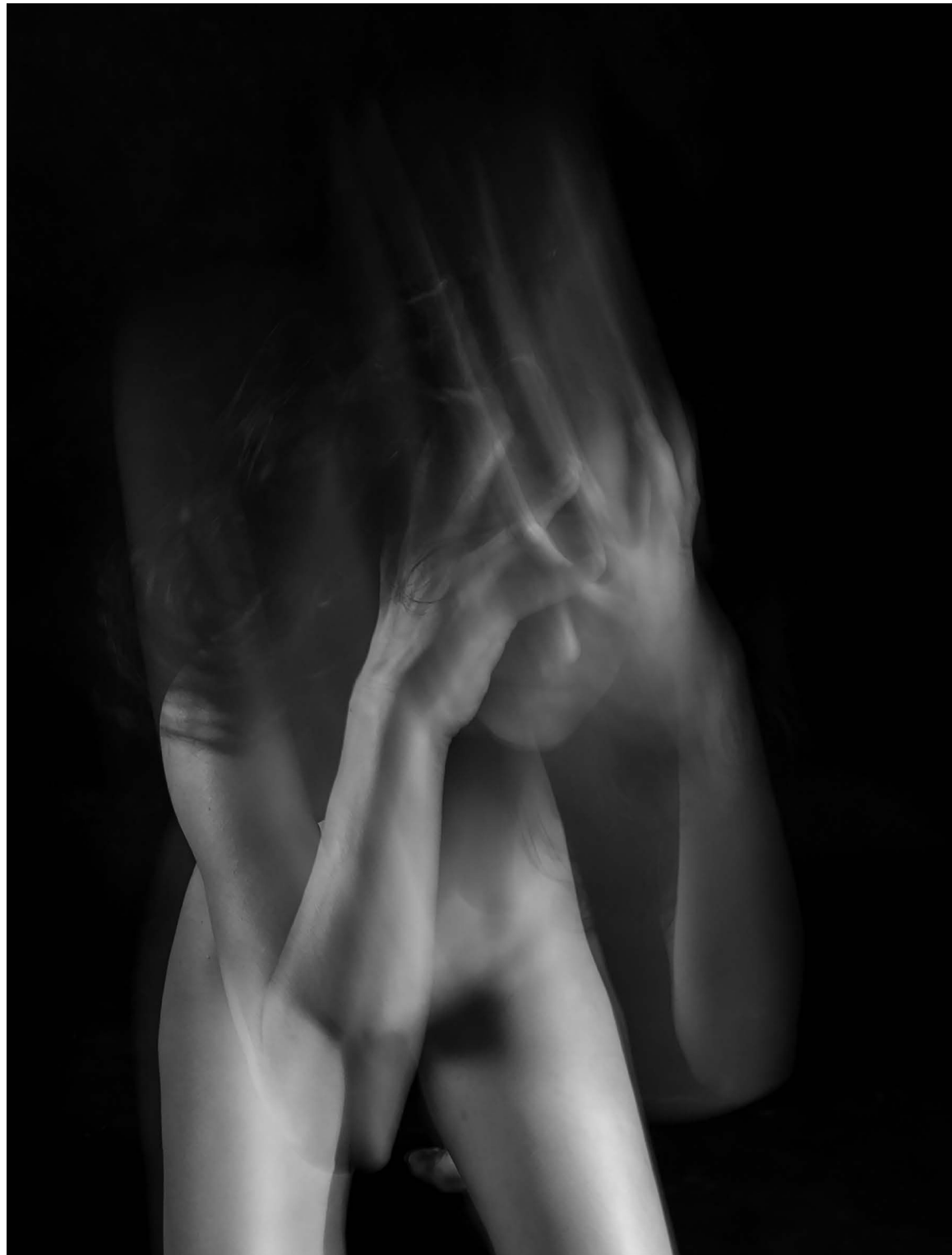
Nasilje nad ženskami 9