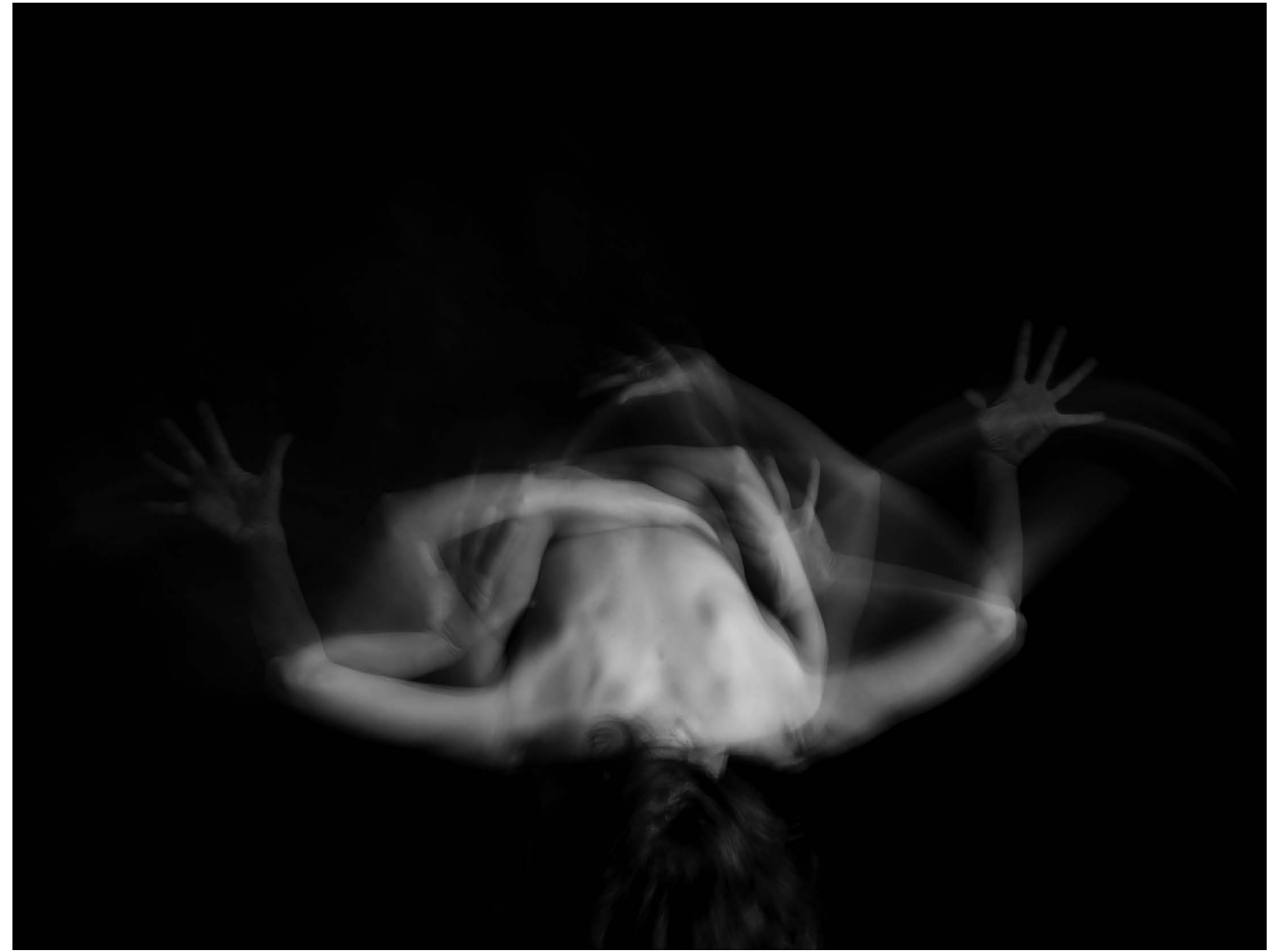
Nasilje nad ženskami 16