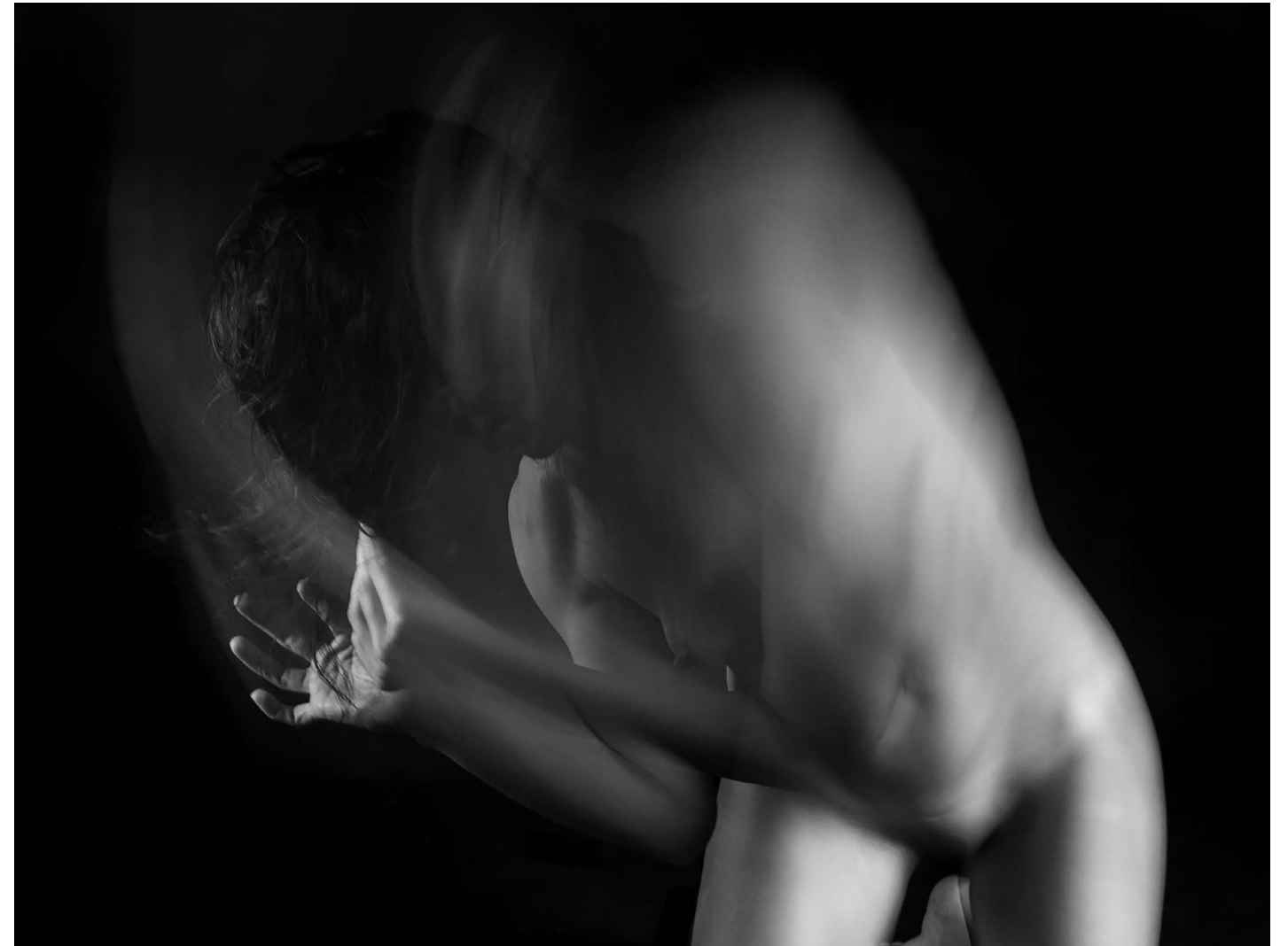
Nasilje nad ženskami 6