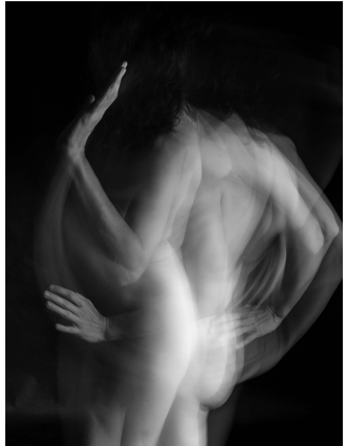
Nasilje nad ženskami 8