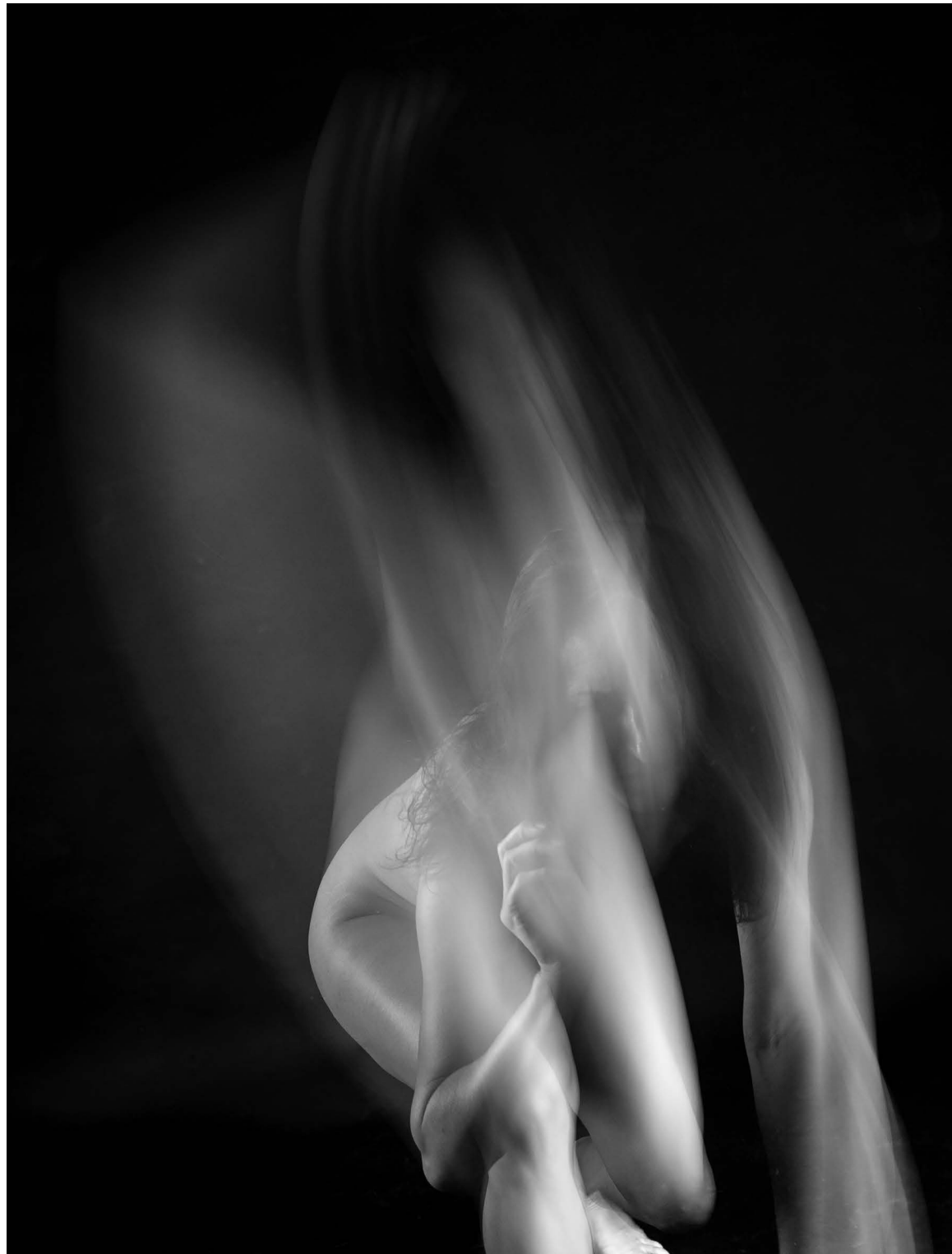
Nasilje nad ženskami 7