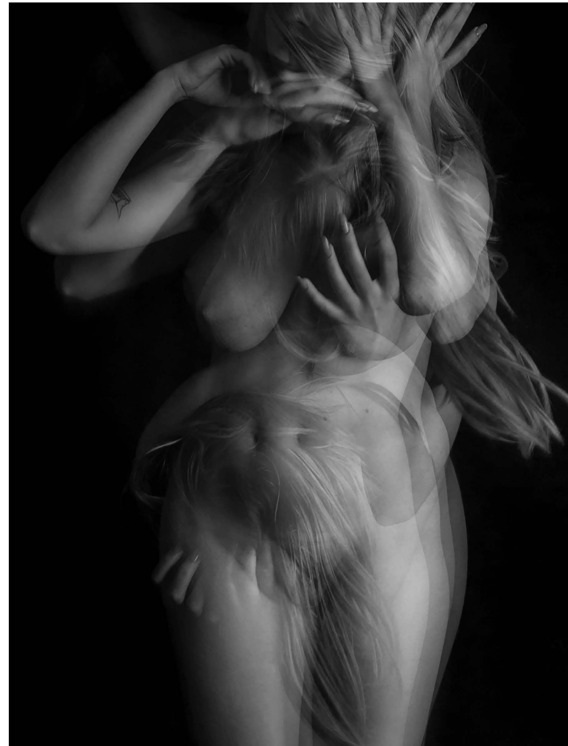
Nasilje nad ženskami 12