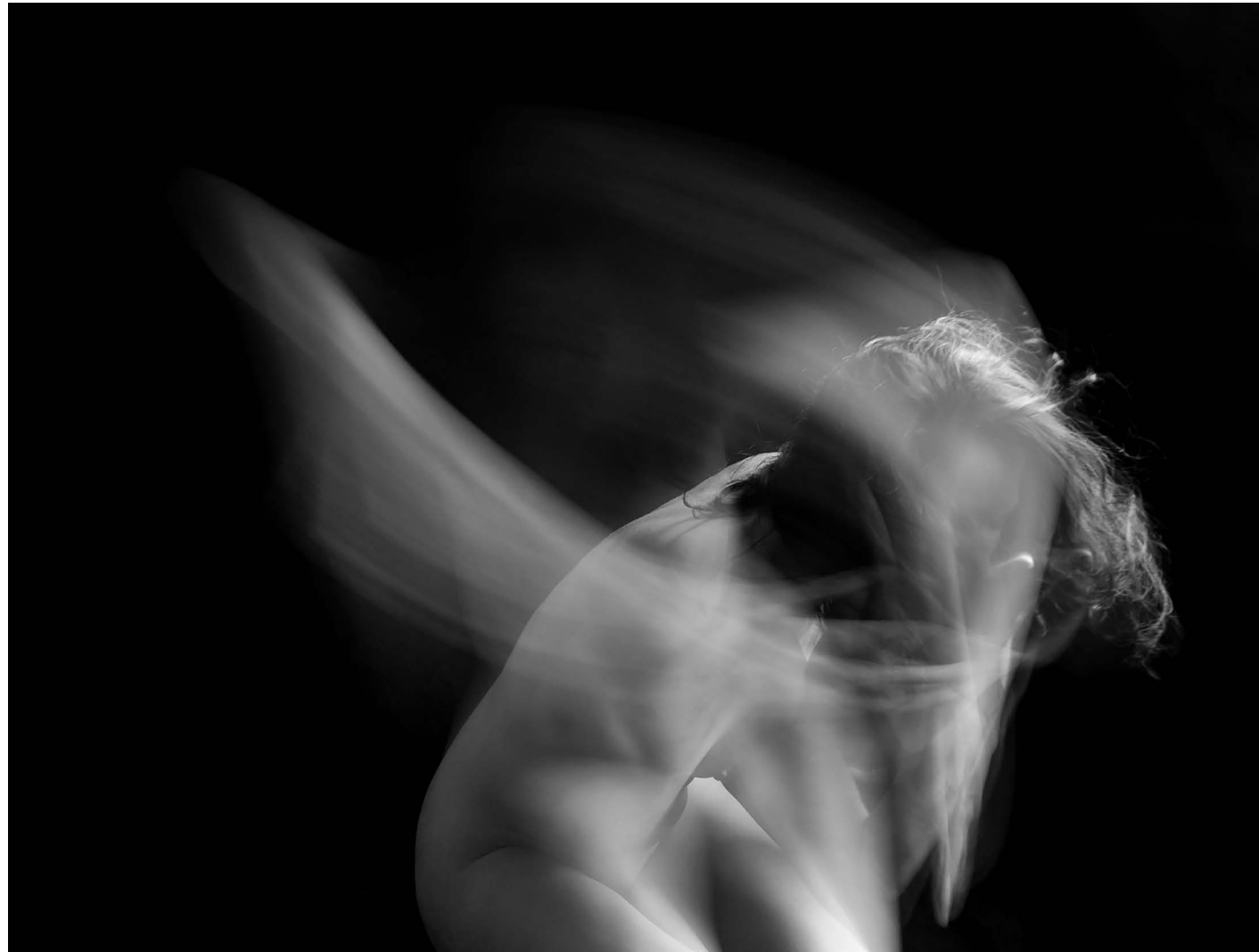
Nasilje nad ženskami 5