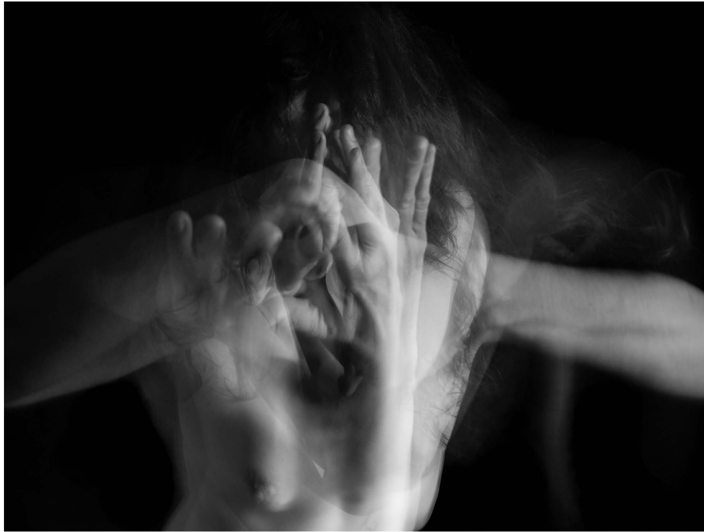
Nasilje nad ženskami 15