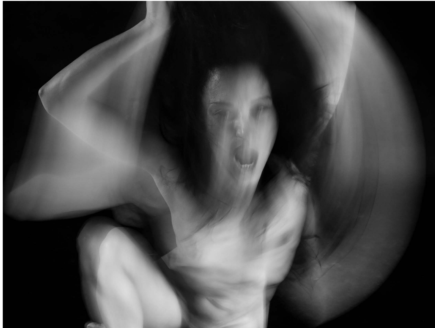
Nasilje nad ženskami 17