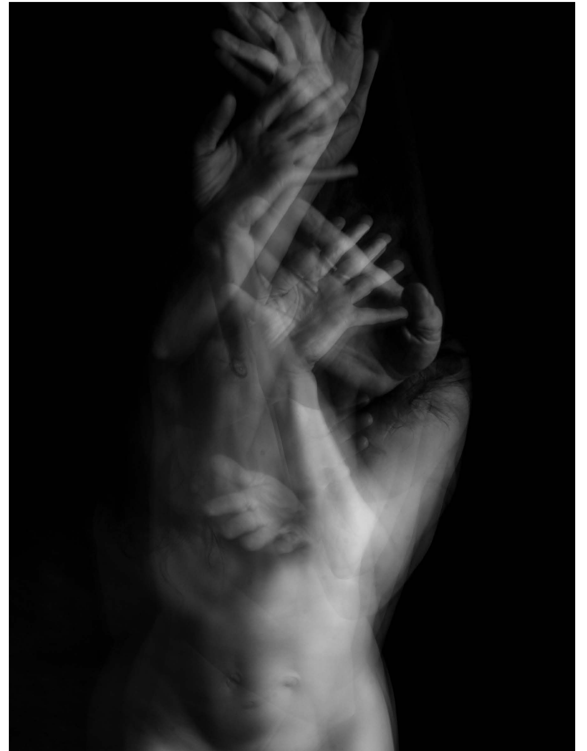
Nasilje nad ženskami 14