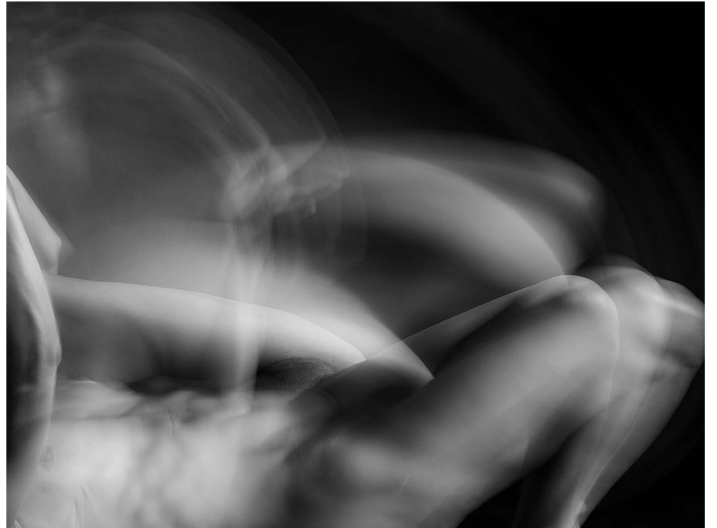
Nasilje nad ženskami 18